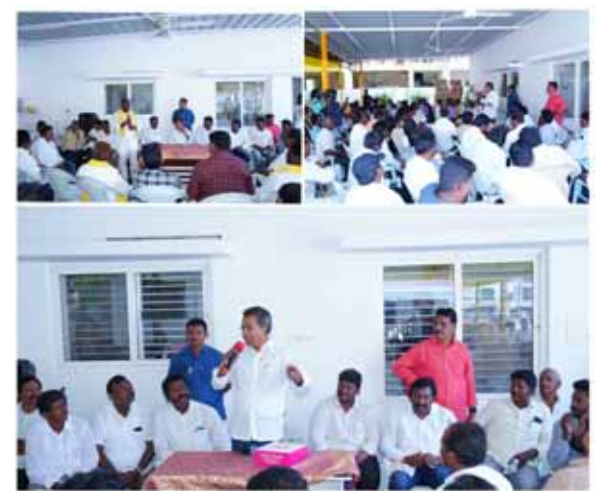
అక్షర విజేత మైలవరం నియోజకవర్గం ప్రజలు:

- భారత రాజ్యాంగ నిర్మాత డాక్టర్ బి.ఆర్ అంబేద్కర్ ఎస్సీలకు ఇచ్చిన హక్కులను ఈ ప్రభుత్వం ఎందుకు కాలరాస్తోంది?