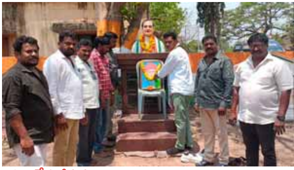
లక్షర విజేత, భీమవరం: