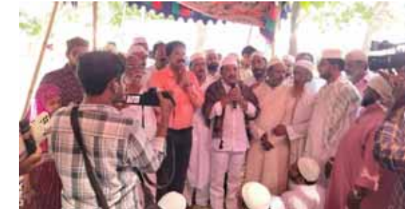
లక్షర విజేత, భీమవరం: