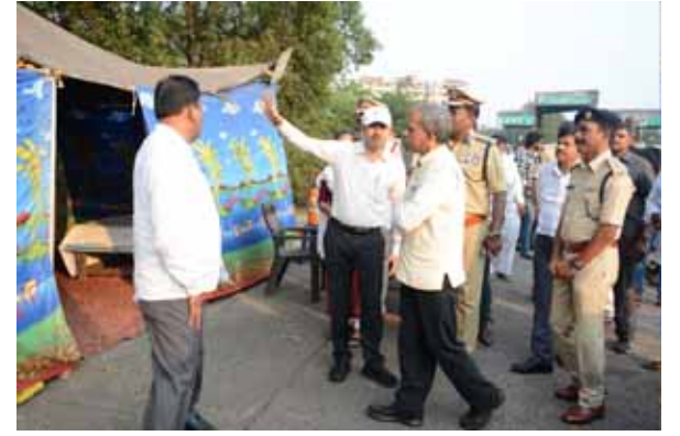
అక్షర విజేత విశాఖ బ్యూరో: