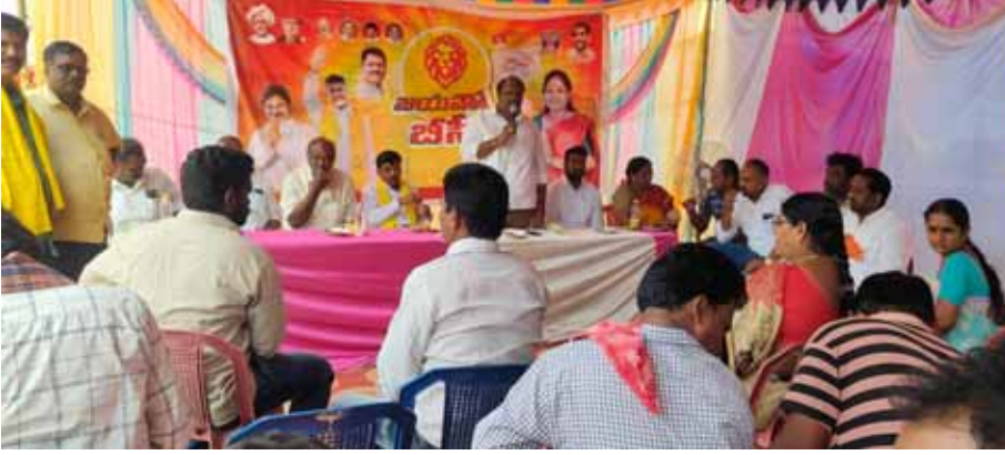
అక్షరవిజేత, పాఠశాలకు పేట: