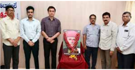
అక్షర విజేత, భీమవరం: