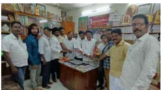
అక్షర విజేత, భీమవరం: