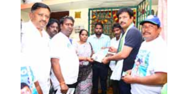
లక్షర విజేత విశాఖ బ్యూరో: