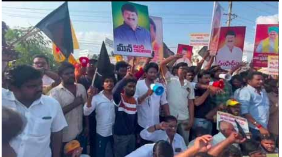
అక్షర విజేత, భీమవరం: