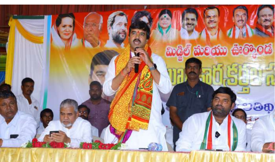
అక్షర విజేత: జడ్పర్: