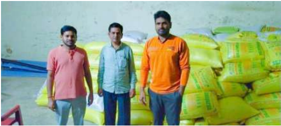
అక్షర విజేత అదిలాబాద్ ప్రతినిధి: