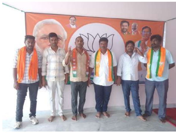
అక్షర విజేత మలిపెడ: