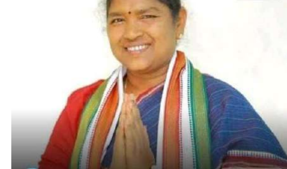
అక్షర విజేత అదిలాబాద్ ప్రతినిధి :