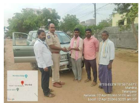
అక్షర విజేత సిద్దిపేట :

రాజగోపాలపేట పోలీస్ స్టేషన్ ఎదురుగా వాహనాల తనిఖీలలో భాగంగా 1,10,000 రూపాయలు పట్టుకొని సీజ్ చేయడం జరిగింది. ఈ కార్యక్రమంలో పోలీస్ కమిషనర్ మాట్లాడుతూ శ్రీ అండ్ ఫెయిర్ ఎన్నికల నిర్వహణ గురించి, ఎన్నికల కోడ్ అమల్లో ఉన్నందున 50 వేల కంటే ఎక్కువ డబ్బులు వెంట తీసుకుని వెళ్లకూడదని సూచించారు. ఎవరైనా అత్యవసరంగా డబ్బులు తీసుకొని వెళితే సంబంధిత ఆధారాలు తప్పకుండా వెంటబడి ఉంచుకోవాలని సూచించారు. వాహనాల తనిఖీ నిర్వహించేటప్పుడు సిబ్బంది అప్రమత్తంగా ఉండాలని తెలిపారు. వాహనదారులు కూడా పోలీస్ శాఖకు సహకరించాలని సూచించారు. ఓటర్లను ప్రభావితం చేయకుండా డబ్బులు, ఇతర గిఫ్ట్ ఆర్టికల్స్, లిక్కర్ అక్రమ రవాణా జరగకుండా తనిఖీలు నిర్వహించడం జరుగుతుందన్నారు.