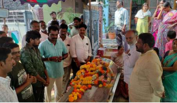
అక్టర్ విజేత వనపర్తి ప్రతినిధి :