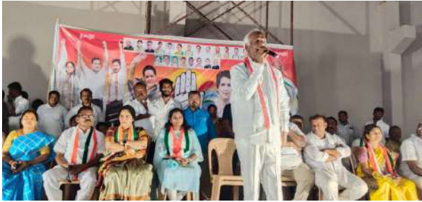
లక్ష్మర విజేత,రఘునాథపల్లి :

- కాంగ్రెస్ తోనే అన్ని వర్గాలకు సంక్షేమ పథకాలు