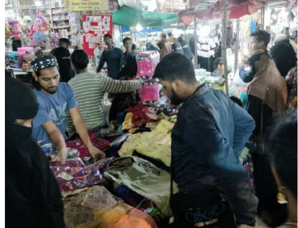
లక్ష్మర విజేత,రఘునాథపల్లి :

- కాంగ్రెస్ తోనే అన్ని వర్గాలకు సంక్షేమ పథకాలు