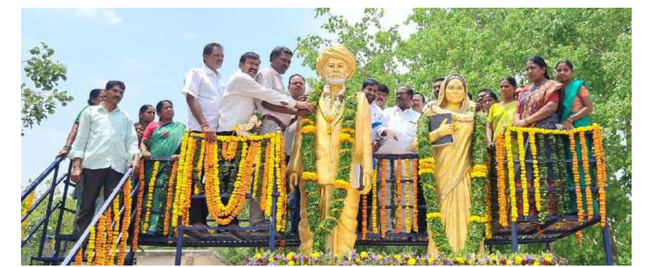
అక్షర విజేత, చిగురుమామిడి: