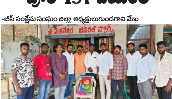
అక్షర విజేత మలిపెడ: