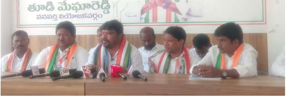
అక్షర విజేత వనపర్తి ప్రతినిధి: