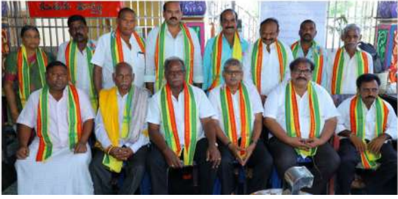
అక్షర విశేష, మధిర: