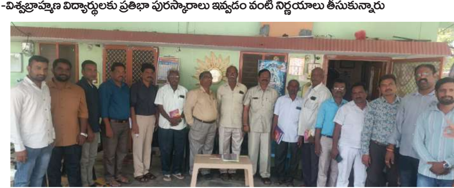
అక్షర విజేత, చావ్వనండి:

-పట్టణంలో చలివేంద్రం ఏర్పాటు -విశ్వబ్రాహ్మణ విద్యార్థులకు ప్రతిభా పురస్కారాలు ఇవ్వడం వంటి నిర్ణయాలు తీసుకున్నారు