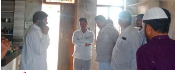
అక్షర విజేత వనపర్తి ప్రతినిధి:

-మూడు లక్షల ఆస్తి రద్దీ -కుటుంబానికి త్వరిత ధరిన తపస్వి ప్రమాదం -కుటుంబానికి భరోసా