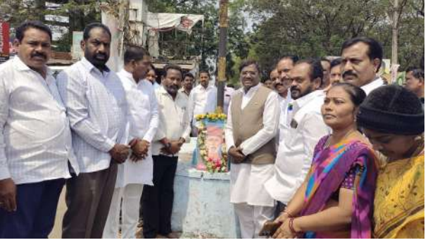
అక్షర విశేష రామకృష్ణపూర్: