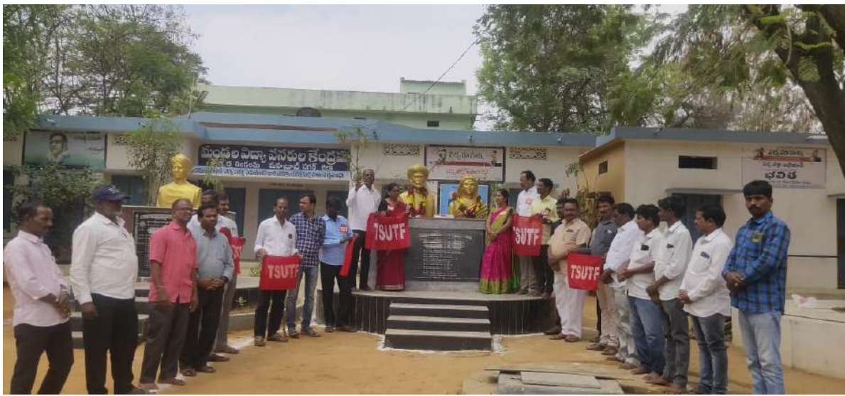
అక్షర విజేత జడ్చర్ల :