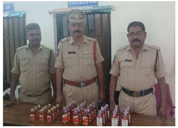
అక్షర విజేత సిద్దిపేట :

టూ టౌన్ పోలీస్ స్టేషన్ పరిధిలోని కరీంనగర్ రోడ్డు హనుమాన్ నగర్ లో దండుగుల స్వప్న తన కిరాణి షాప్ లో ఎలాంటి ప్రభుత్వ అనుమతి లేకుండా అక్రమంగా బెల్ట్ షాప్ నడుపుచున్నాడని సమీప గిరి సమాచారంపై గురువారం సాయంత్రం సమయమున సిద్దిపేట టూ టౌన్ ఇన్స్పెక్టర్ ఉపేందర్, సిబ్బందితో కలిసి వెళ్లి రైడ్ చేసి విన్సీ బాటిల్లు మొత్తం 4.220 లీటర్ల మద్యం బాటిల్ లను స్వాధీనం చేసుకుని కేసు నమోదు చేసి పరిశోధన ప్రారంభించారు. ఈ సందర్భంగా ఇన్స్పెక్టర్ ఉపేందర్ మాట్లాడుతూ ఇండ్లలో, హోటల్లలో, ఫాస్ట్ ఫుడ్ సెంటర్లలో, కిరాణి షాపులలో, ఇతర దుకాణాలలో ఎలాంటి ప్రభుత్వ పర్మిట్ లేకుండా అక్రమంగా బెల్ట్ షాప్ నడిపితే, మరియు బహిరంగ ప్రదేశంలో కానీ ఇళ్లలో గానీ పేకాట ఆడితే సమాచారం అందించాలని కోరారు. జూదం పేకాట ఆడిన వారిపై చట్టపరమైన చర్యలు తీసుకుంటామని హెచ్చరించారు. ఎలాంటి ప్రభుత్వ అనుమతి లేకుండా ఇసుక, పిడిఎస్ రైస్, అక్రమ రవాణా చేసిన మరియు పేకాట, జూదం, గంజాయి ఇతర మత్తు పదార్థాలు విక్రయించిన కలిగి ఉన్న చట్ట వ్యతిరేక కార్యక్రమాలకు పాల్పడుతున్నటు సమాచారం ఉంటే వెంటనే సిద్దిపేట టూ టౌన్ పోలీసులకు సమాచారం అందించాలని సూచించారు. సమాచారం అందించిన వారి పేర్లను గోప్యంగా ఉంచుతామని తెలిపారు.