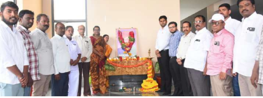
అక్షర విజేత జోగులాంబ గద్దాల ప్రతినిధి: