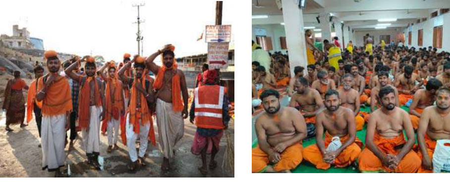
అక్షర విజేత మల్వాల కొండగట్టు