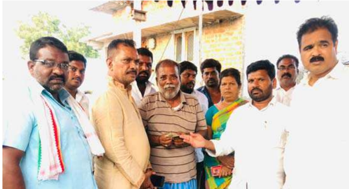
అక్షర విజేత కొండపాక