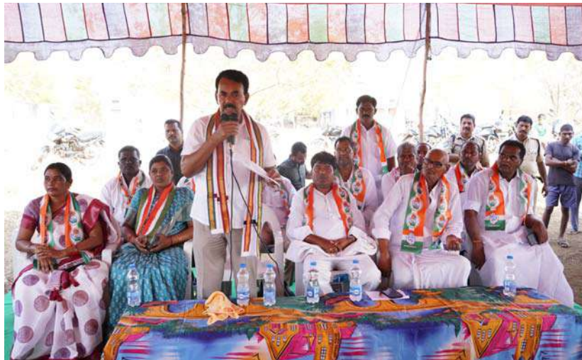
తర్వాత ప్రతి గ్రామానికి నేనే స్వయంగా వస్తానని నిజమైన లబ్ధిదారులకు ఇందిరమ్మ ఇళ్ళు మంజూరు చేస్తామని హామీ ఇచ్చారు. ఇచ్చిన మాట ప్రకారం రైతు రుణమాఫీ కూడా చేస్తామని గ్రామ ప్రజలకు తెలియజేశారు. ఈ కార్యక్రమంలో చిన్నబావి మండల కాంగ్రెస్ పార్టీ సీనియర్ నాయకులు, తాజా మాజీ ప్రజా ప్రతినిధులు, ప్రజలు కార్యకర్తలు పెద్ద ఎత్తున పాల్గొన్నారు.