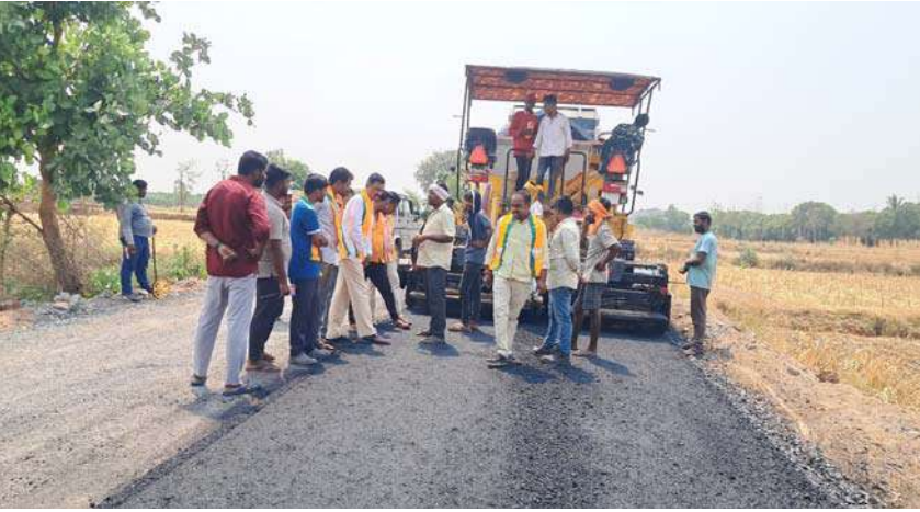
అక్షర విజేత: చిగురుమామిడి