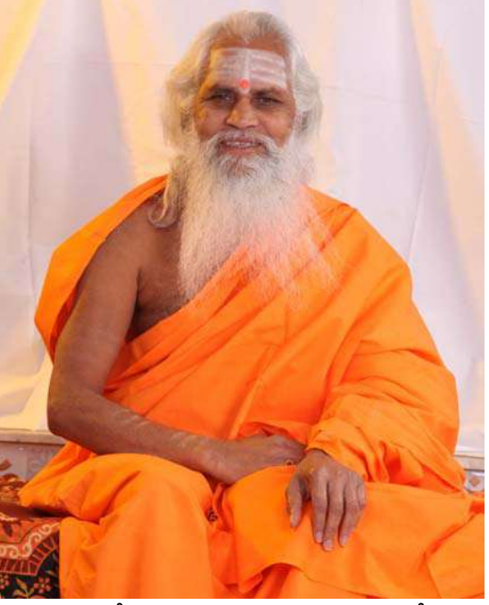
సాయిబాబా దేవాలయాల గురించి భక్తులందరినీ సమిష్టిగా దేవాలయ నిర్మాణంలో పాల్గొనడానికి వీలుగా కొన్ని కార్యక్రమాలను ప్రకటించబడతాయి కావున శివంపేట మండలంలోని భక్తులందరూ విచ్చేసి శ్రీ గురుదేవుల ఆశీస్సులు పొందగలరని శ్రీ గురు పీఠం చారిటబల్ ట్రస్ట్ ఆహ్వానిస్తుంది.