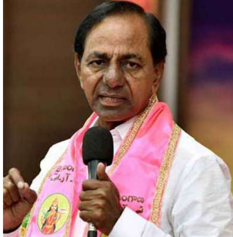
చెప్పారు” అని కేసీఆర్ తెలిపారు.

కాంగ్రెస్ ప్రభుత్వంపై ప్రజల్లో వ్యతిరేకత బాగా ఉందని భారాస అధినేత కేసీఆర్ అన్నారు. తెలంగాణభవన్ లో పార్టీ లోక్ సభ అభ్యర్థులు, ఎమ్మెల్యేలు, ఎమ్మెల్సీలు, ముఖ్య నాయకులతో ఆయన సమావేశమయ్యారు. కాంగ్రెస్ నేతలు కొందరు తనతో టచ్ లో ఉన్నారని, అక్కడ అంతా భాజపా పెత్తనమే నడుస్తోందని వారు చెప్పారని కేసీఆర్ వ్యాఖ్యానించారు. “కాంగ్రెస్ లోకి వెళ్లిన నేతలు బాధపడుతున్నారు. గతంలో 104 మంది ఎమ్మెల్యేలున్న మన ప్రభుత్వాన్ని కూల్చేందుకే భాజపా ప్రయత్నించింది.. 64 మంది ఎమ్మెల్యేలున్న కాంగ్రెస్ ను వదిలిపెడుతుందా? లోక్ సభ ఎన్నికల తర్వాత రాష్ట్రంలో రాజకీయంగా గందరగోళం తలెత్తుతుంది. ఏం జరిగినా మనకే మేలు. రాష్ట్రంలో భవిష్యత్ భారాసదే” అని కేసీఆర్ అన్నారు. “కాంగ్రెస్ పై తీవ్ర వ్యతిరేకత ప్రారంభమైంది. రానున్న రోజులు మనవే. కాంగ్రెస్ ప్రభుత్వంలో టీమ్ వర్క్ లేదు.. స్థిరత్వం లేదు. ఉద్యమకాలం నాటి కేసీఆర్ ను మళ్లీ చూస్తారు. కవితపై ఎలాంటి కేసు లేదు.. అయినా.. కక్ష కట్టి అరెస్టు చేశారు. భాజపా సీనియర్ నేత బీఎల్ సంతోష్ కు నోటీసులు పంపాం. ఆ పార్టీ కేంద్ర కార్యాలయానికి రాష్ట్ర పోలీసులు వెళ్లారు. అందుకే మనపై కక్ష పెంచుకున్నారు. ఇసుక కుంగడం వల్లే మేడిగడ్డ ఆనకట్ట వద్ద సమస్య తలెత్తింది. రాష్ట్రంలో ధాన్యం కొనుగోలు చేసే పరిస్థితిలో మిల్లర్లు లేరు. అన్నింటా ప్రభుత్వ వైఫల్యం స్పష్టంగా కనిపిస్తోంది. కాంగ్రెస్ ప్రభుత్వం మాట అధికారులు వినడం లేదు. కాంగ్రెస్ ను నమ్మడం లేదని అసదుద్దీన్ ఓవైసీ