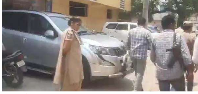
అక్షర విజేత ఆదిలాబాద్ ప్రతినది:-