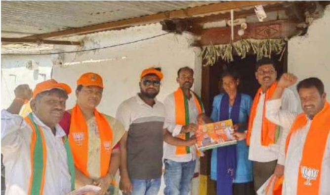
అక్షరవిజేత, వికారాబాద్ ప్రతినిధి