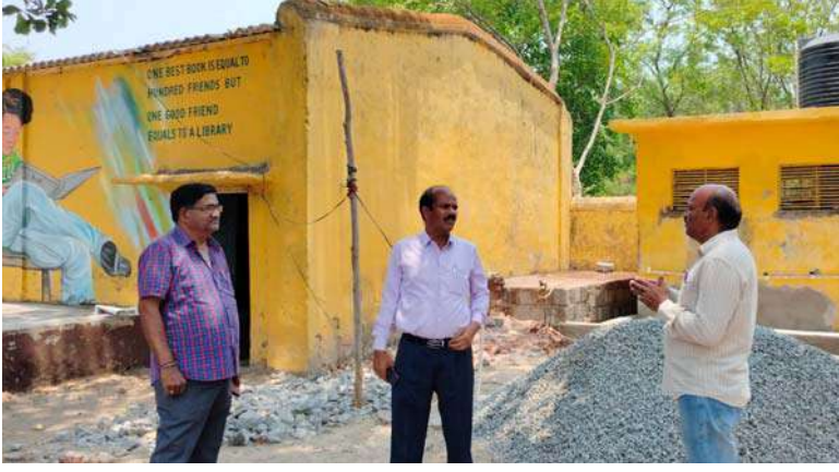
అక్షర విజేత రామకృష్ణాపూర్