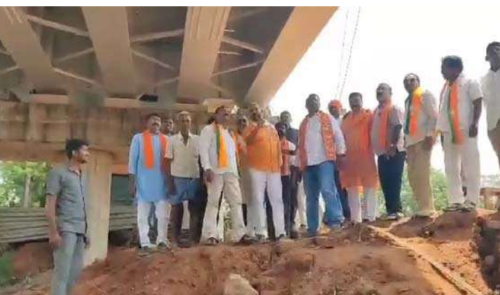
అక్షర విజేత కాగజ్ నగర్ ప్రతినిధి