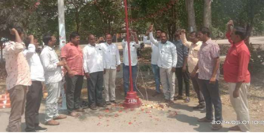
అక్షర విజేత ,శివపేట.