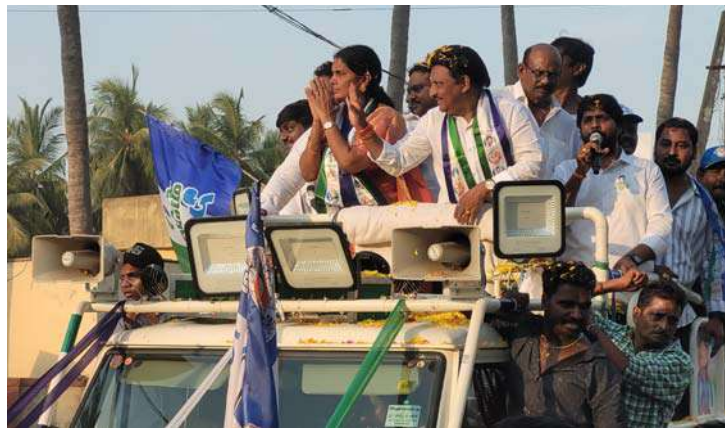
అక్షర విజేత, భీమవరం: