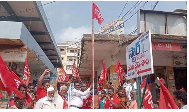
అక్షర విజేత: చింతలపూడి