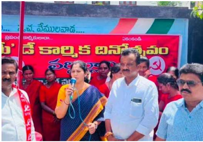
అక్షర విజేత వేములవాడ :