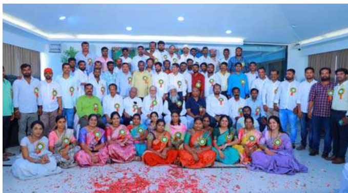
అక్షర విజేత కొండపాక

సందడిగా 20 సంవత్సరాల వార్షికోత్సవ వేడుకలు