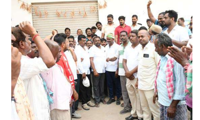
అక్షర విజేత వనపర్తి ప్రతినిధి

గత వారంలో రోజులుగా గంజి దగ్గర ఉండే బజారు హమాళీలు తమ సమస్యలపై అఖిలపక్ష ఐక్యవేదికను సంప్రదించగా, రెండు రోజుల క్రితం వారి వద్దకు వెళ్లి వారి సమస్యలను పత్రిక ముఖంగా ఎమ్మెల్యేకు జిల్లా కలెక్టర్ కి విన్నవించడం జరిగింది.