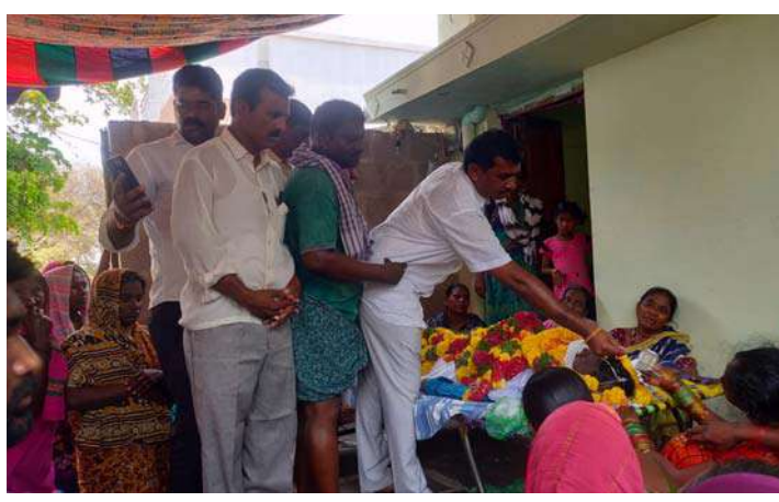
అక్షర విజేత అలంపూర్