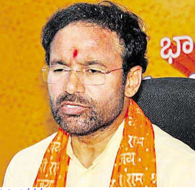
మిగతా 2 పేజీలో

అక్షరవిజేత, తెలంగాణస్టేట్ బ్యూరో పదేళ్ల యూపీఏ హయాంలో, తొమ్మిదిన్నరేళ్ల ఎన్డీయే ప్రభుత్వ హయాంలో తెలంగాణ అభివృద్ధికి ఏం చేశారన్న అంశంపై చర్చకు రావాలని ముఖ్యమంత్రి రేవంత్ రెడ్డికి కేంద్ర మంత్రి, భాజపా రాష్ట్ర అధ్యక్షుడు కిషన్ రెడ్డి సవాల్ విసిరారు. ప్రెస్ క్లబ్ లేదా అమరవీరుల స్తూపం లేదంటే భాగ్యలక్ష్మి ఆలయం వద్దకు చర్చకు రావాలన్నారు. సీఎం తన నెత్తిపై 'గాడిద గుడ్డు' బొమ్మ పెట్టుకుని తప్పుడు ప్రచారం చేస్తున్నారని.. దీన్ని ప్రజలు నమ్మరని అన్నారు. బహుశా ప్రజలకు తాను ఇచ్చేది 'గాడిద గుడ్డు' మాత్రమేనని ఇలా చేస్తున్నారేమోనని ఎద్దేవా చేశారు. ఎన్నికల సమయంలో కాంగ్రెస్ ఇచ్చిన ఆరు గ్యారంటీలను గాలికొదిలేశారని, చేసిన, చేయబోయే పనుల గురించి చెప్పడం లేదని విమర్శించారు. సీఎం రేవంత్ రెడ్డి నిజస్వరూపాన్ని తెలంగాణ ప్రజలు తెలుసుకుంటున్నారన్నారు. బుధవారం భాజపా రాష్ట్ర కార్యాలయంలో పార్టీ రాష్ట్ర ప్రధాన కార్యదర్శి జి. ప్రేమేందర్ రెడ్డితో కలిసి కిషన్ రెడ్డి విలేజరుల సమావేశంలో మాట్లాడారు. రాష్ట్రంలో కాంగ్రెస్ పై రోజురోజుకు ప్రజల్లో వ్యతిరేకత పెరుగుతోందన్నారు. రాష్ట్రంలో 14 ఎంపీ సీట్లు గెలుస్తామని మొదట రేవంత్ రెడ్డి చెప్పారని.. ఇప్పుడు తన కాళ్ల కింద భూమి కదిలిపోతుండటంతో ఏం చేయాలో తెలియక రోజుకొకలా మాట్లాడుతున్నారని విమర్శించారు. గుజరాత్ పెత్తనానికి, తెలంగాణ పౌరుషానికి పోటీ అని ఆయన అంటున్నారని.. కాంగ్రెస్ పార్టీకి తెలంగాణ భాజపా పౌరుషం చాలని చెప్పారు. రేవంత్ రెడ్డి ఏరోజైనా తెలంగాణ ఉద్యమంలో పాల్గొన్నారా అని కిషన్ రెడ్డి ప్రశ్నించారు. ఆయన ఉద్యమానికి వ్యతిరేకంగా మాట్లాడారన్నారు.