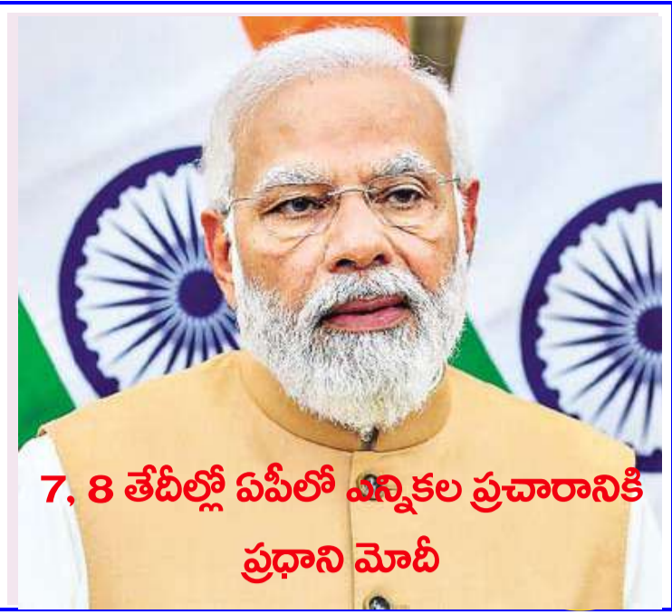
7, 8 తేదీల్లో ఏపీలో ఎన్నికల ప్రచారానికి ప్రధాని మోదీ