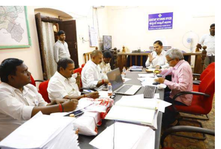
అక్షరవిజేత, వికారాబాద్ ప్రతినిధి