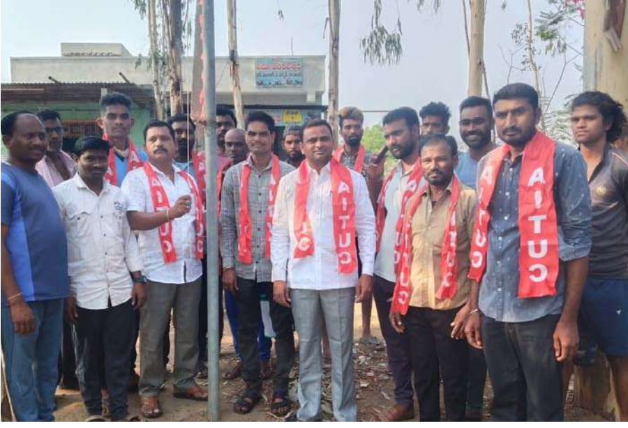
అక్షర విజేత ఆదిలాబాద్ ప్రతినిధి:-