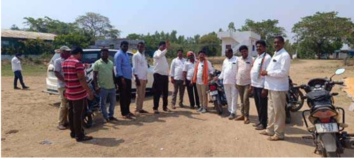
అక్షర విజేత బయ్యారం