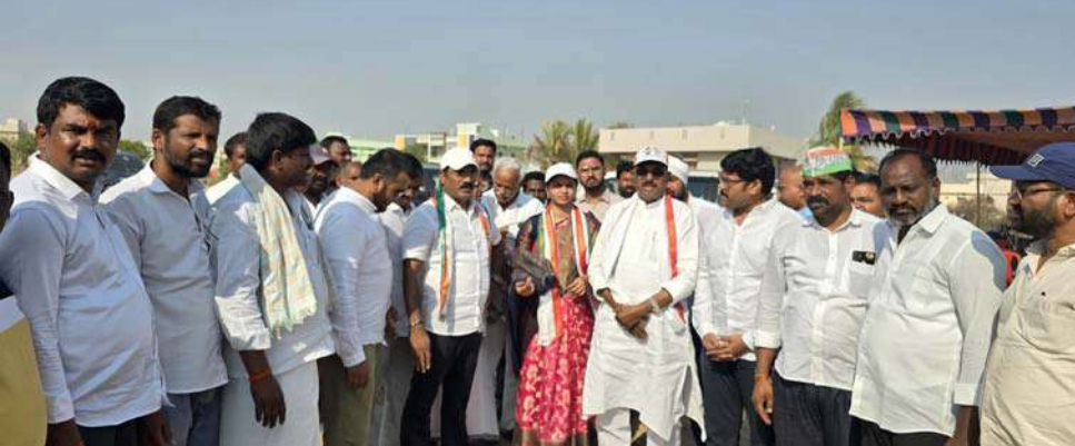
అక్షర విజేత అలంపూర్