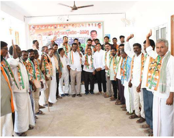
అక్షర విజేత వనపర్తి ప్రతినిధి