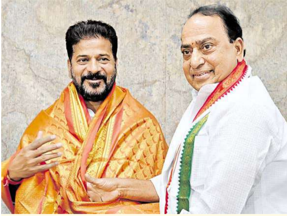
అక్షరవిజేత, తెలంగాణస్టేట్ బ్యూరో

లోకసభ ఎన్నికల నేపథ్యంలో జాతీయ కాంగ్రెస్ పార్టీ తెలంగాణకు ప్రత్యేక మ్యూనిసిపాలిటీ విడుదల చేయనుంది. శుక్రవారం ఉదయం 11 గంటలకు ముఖ్యమంత్రి, పీసీసీ అధ్యక్షుడు రేవంత్ రెడ్డి దీన్ని ఆవిష్కరిస్తారు. కాంగ్రెస్ పార్టీకి ఈ కార్యక్రమానికి ఉప ముఖ్యమంత్రి భట్టి విక్రమార్కు, మంత్రిలు, ఎమ్మెల్యేలు, ఇతర ముఖ్య నాయకులు హాజరవుతారు. కాంగ్రెస్ పార్టీ కేంద్రంలో అధికారంలోకి వస్తే.. రాష్ట్రానికి ఏం చేస్తుందనే విషయాలను ఈ మ్యూనిసిపాలిటీ ద్వారా వివరించనున్నారు. ఇప్పటికే జాతీయస్థాయిలో 'న్యాయ పత్ర' పేరుతో కాంగ్రెస్ మ్యూనిసిపాలిటీ విడుదల చేసిన సంగతి తెలిసిందే. పార్టీ పర్యటన సమాచారం మేరకు.. రాష్ట్ర పునర్విభజన హామీలైన రైల్వే కోచ్ ఫ్యాక్టరీ, బయ్యారం ఉక్కు పరిశ్రమ ఏర్పాటుతో పాటు పాలమూరు- రంగారెడ్డి ఎత్తిపోతలకు జాతీయ హెరాదా, కనీసం ఒక్క ఐఐఎం, ఐఐఐటీ, ఎన్ఐఐటీ