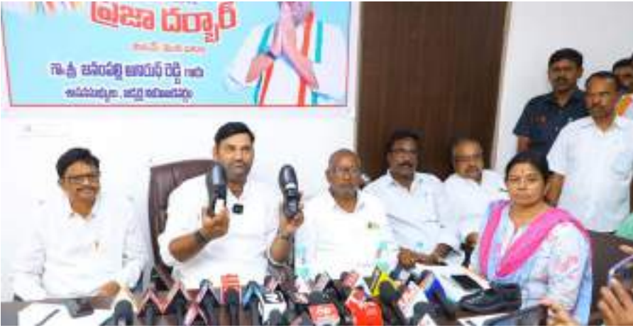
అక్షర విజేత: జడ్చర్ల :