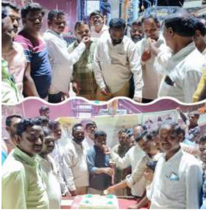
అక్షర విజేత / పెంట్లవెల్లి

జటప్రోలు గ్రామంలో ఆన్‌పాసివ్ సభ్యుల ఆధ్వర్యంలో ఘనంగా ఆన్‌పాసివ్ ఆవిర్భావ దినోత్సవం నిర్వహించారు ఆన్‌పాసివ్ వినూత్నమైన ఇంటర్నెట్ సేవలను దేశీయ మార్కెట్‌కు పరిచయం చేసింది. ఇంటర్నెట్ రంగంలో అవసరమైన సరికొత్త సేవల్లో మెయిలింగ్ పరిష్కారాలను అందిస్తూ ఓ-మెయిల్, సోషల్ నెట్‌వర్కింగ్కు తోడ్పడేందుకు ఓ-నెట్, వీడియో కాన్ఫరెన్సింగ్ కోసం ఓ-కనెక్ట్ సేవలను మరిన్ని సేవలు అందిస్తున్న సంస్థ ఆన్‌పాసివ్ అని మేము మా క్లయింట్లకు బలమైన కస్టమర్ సంబంధాలను ఏర్పరచుకోవడం, అమ్మకాలను పెంచుకోవడం, కొత్త అవకాశాలను అన్వేషించడం మరియు వారి వ్యాపారాలను ఆప్టిమైజ్ చేయడానికి మార్కెటింగ్ ఫలితాలను విశ్లేషించడంపై దృష్టి సారినాము. నేటి అత్యంత పోటీతత్వ మార్కెట్లో మా క్లయింట్ల మొత్తం విలువ ప్రతిపాదనను పెంచే వినూత్న పరిష్కారాలను అందించడానికి మేము కట్టుబడి ఉన్నామని అన్నారు.