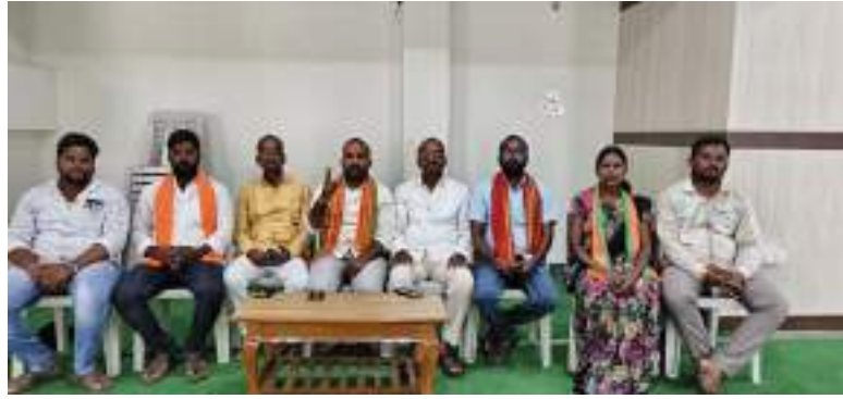
అక్షర విజేత. రామాయంపేట