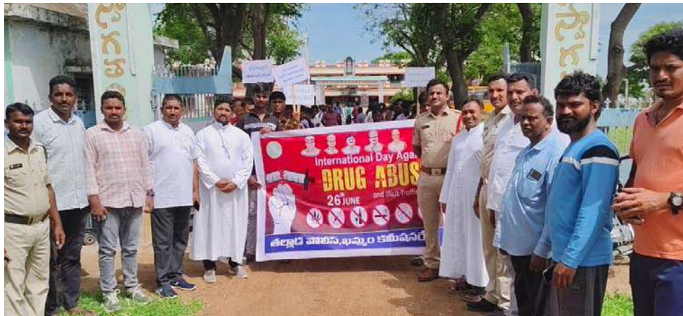
అక్షర విజేత తల్లాడ: