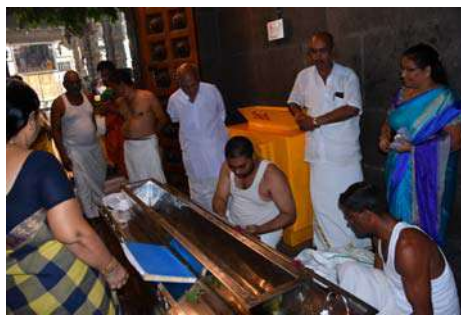
అక్షర విజేత ఎర్రపాలెం: