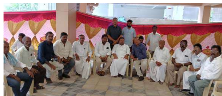
అక్షర విజేత, చొప్పదండి: