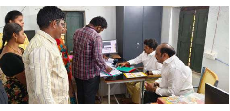
అక్షర విజేత జీలుగుమిల్లి

నేడు జీలుగుమిల్లి మండలం తాటియాకులగూడెం గ్రామ సచివాలయాన్ని పోలవారం ఎమ్మెల్యే శ్రీ చిల్లి బాలరాజు , జిల్లా కార్యదర్శి గడ్డమనుగు రవికుమార్ అకస్మికంగా తనిఖీ చేయడం జరిగింది. ఈ కార్యక్రమంలో సచివాలయం సిబ్బందితో ముఖాముఖీ కార్యక్రమం పాల్గొనడం జరిగింది.పంచాయతీ లో గల సమస్యలపై అధికారులను వివరణ కోరడం జరిగింది .. అన్ని డిమాండ్లపై సరైన పత్రాలు లేకపోవడం, రిజిస్టర్ పాటింపకపోవడం, సెక్రటరీ, సర్పంచ్ సంబంధించిన అధికారులకు నిర్లక్ష్యంగా ఉంటే తగిన చర్యలు తీసుకోవడం జరుగుతుందని హెచ్చరించారు.. గత ప్రభుత్వం వల్ల పడ్డ ఇబ్బందులు అడిగి తెలుసుకున్నారు. పంచాయతీ లో ఎటువంటి సమస్య ఉన్న సంబంధిత అధికారులు నేరుగా ఎమ్మెల్యే కి తెలియజేయగలరని తెలిపారు.