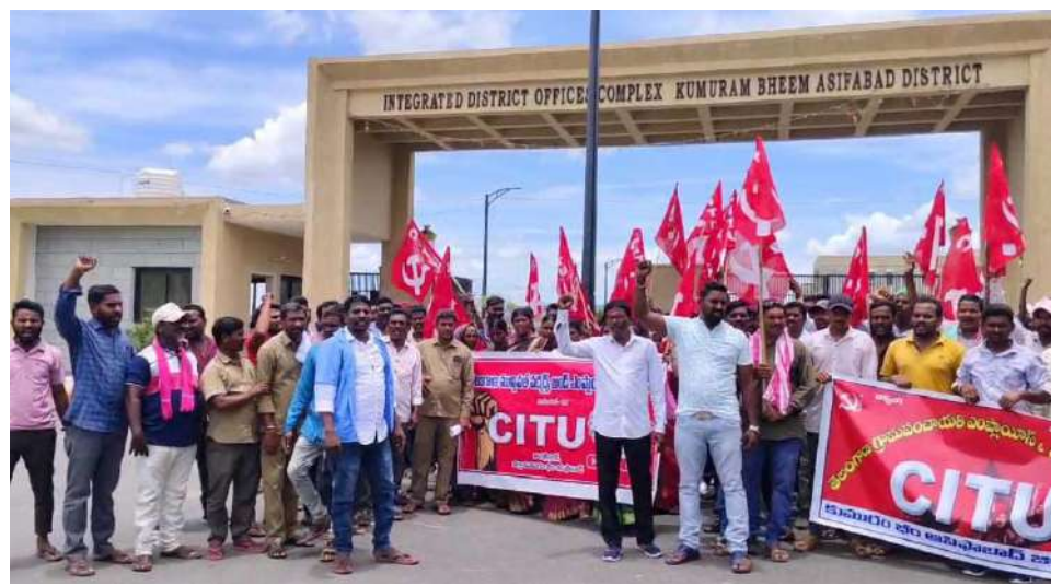
అక్షర విజేత అదిలాబాద్ ప్రతినిధి:-