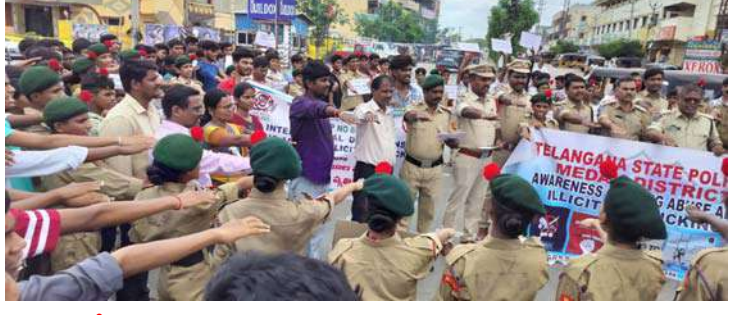
అక్షర విజేత సంగారెడ్డి జిల్లా ప్రతినిధి