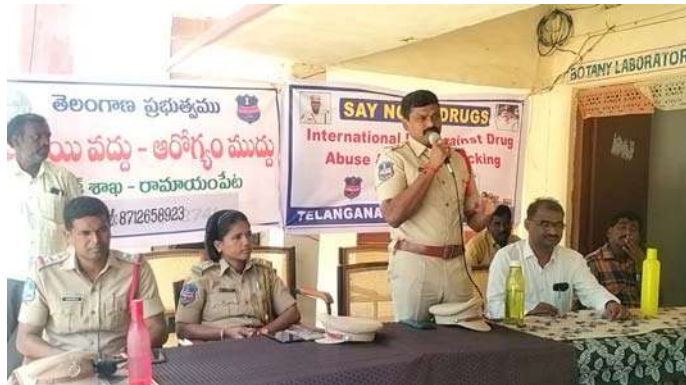
అక్షర విజేత, రామయంపేట