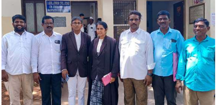
అక్షర విజేత ఖమ్మం టౌన్ :