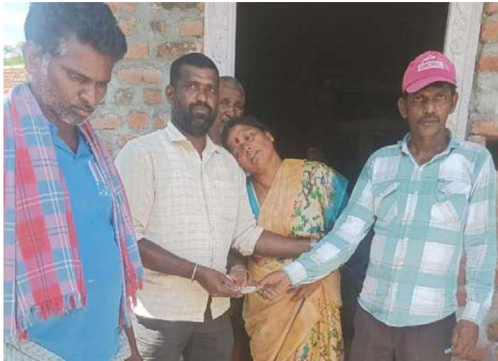
అక్షర విజేత, రామయంపేట