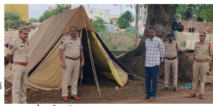
అక్షరవిజేత, ఏకారాబాద్ ప్రతినిధి