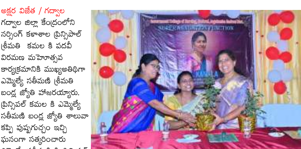
అక్షర విజేత / గద్వాల