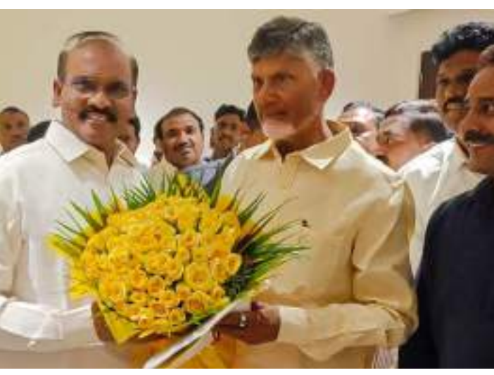
అక్షర విజేత చిలకలూరిపేట