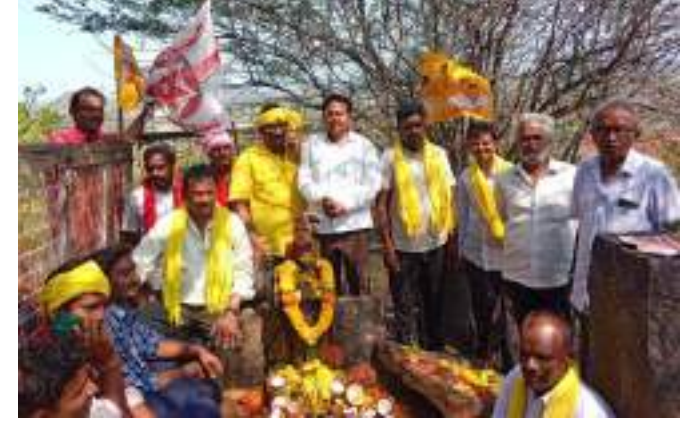
అక్షర విజేత చిలకలూరిపేట