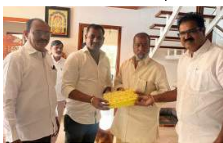
అక్షర విజేత కొండపాక