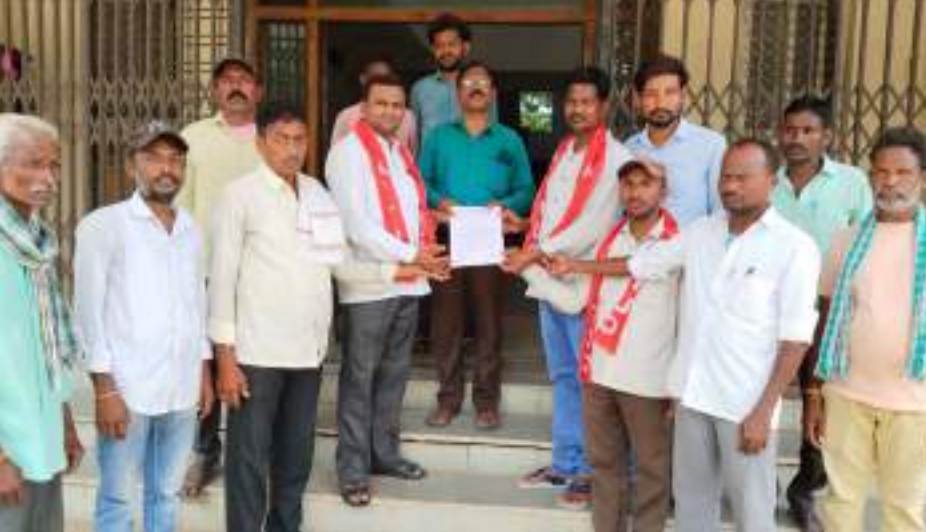
అక్షర విజేత అదిలాబాద్ ప్రతినిధి:-

రెబెన్ మండల ఎంపీడీఓ కార్యాలయంలో వినతిపత్రం