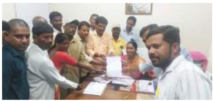
అక్షర విజేత కొండపాక