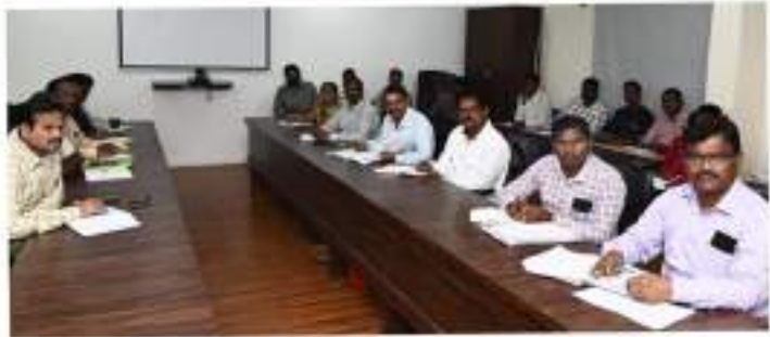
అక్షర విజేత, మరికల్/ధన్వాద:

నారాయణపేట జిల్లా : మిషన్ భగీరథ పథకానికి సంబంధించి ఇంటింటి నల్లా కనెక్షన్ సర్వేను మిషన్ భగీరథ మొబైల్ యాప్ ద్వారా వారం రోజుల్లోపు పూర్తిచేయాలని జిల్లా కలెక్టర్ కోయ శ్రీహర్ష అధికారులను ఆదేశించారు. గురువారం కలెక్టరేట్ లోని వీడియో కాన్ఫరెన్స్ హాల్ లో మిషన్ భగీరథ ఏంట్లా ఈఈ, జిల్లా పంచాయతీ అధికారి, ఎంపీడీవోలు ఎంపీలు, మిషన్ భగీరథ ఇంజనీర్ల తో ఏర్పాటుచేసిన సమావేశంలో కలెక్టర్ మాట్లాడుతూ.. జిల్లాలో ఎన్ని నివాసాలకు మిషన్ భగీరథ కొళాయి కనెక్షన్లు ఉన్నాయో ? ఇంకా ఎవరికైనా కొళాయి కనెక్షన్లు ఇవ్వాలి ఉందా ? కొత్తగా ఇళ్ళు కట్టుకునే వాళ్లకు ఇవ్వాలి కనెక్షన్లు ఎన్ని ఉన్నాయని వివరాలతో కూడిన పూర్తి సమాచారంపై జిల్లావ్యాప్తంగా సర్వే చేపట్టాలని సూచించారు. ఈ సర్వే ను మొక్కుబడిగా చేయకుండా ప్రతి ఇంటికి వెళ్లి ఇంటి యజమాని, కుటుంబ సభ్యుల తో పాటు అదార్ నెంబర్, కులం, మహిళా,పురుషుల వివరాలు, అలాగే మిషన్ భగీరథ నీటి సరఫరా కి సంబంధించిన ఫోటోలను యాప్ లో పొందుపరచాల్సి ఉంటుందని తెలిపారు. జిల్లాలోని పంచాయతీ కార్యదర్శులతో సమన్వయం చేసుకొని ఇంటింటి సర్వేను వారం రోజుల్లోపు పూర్తిచేసే విధంగా ప్రణాళికను రూపొందించుకోవాలని అధికారులను ఆదేశించారు. ఈ మిషన్ భగీరథ సర్వేకు నలుగురు మాస్టర్ ట్రైనర్లు అందుబాటులో ఉంటారని, మిషన్ భగీరథ ఇంజనీర్లు కూడా సర్వే సమయంలో అందుబాటులో ఉండాలన్నారు.ఈ సమావేశంలో స్థానిక సంస్థల అదనపు కలెక్టర్ మయాంక్ మిశ్రా, మిషన్ భగీరథ ఈ ఈ రంగారావు, ఇంచార్జ్ జిల్లా పంచాయతీ అధికారి సుధాకర్ రెడ్డి, అన్ని మండలాల ఎంపీడీఓ లు, ఎంపీఓ లు పాల్గొన్నారు.