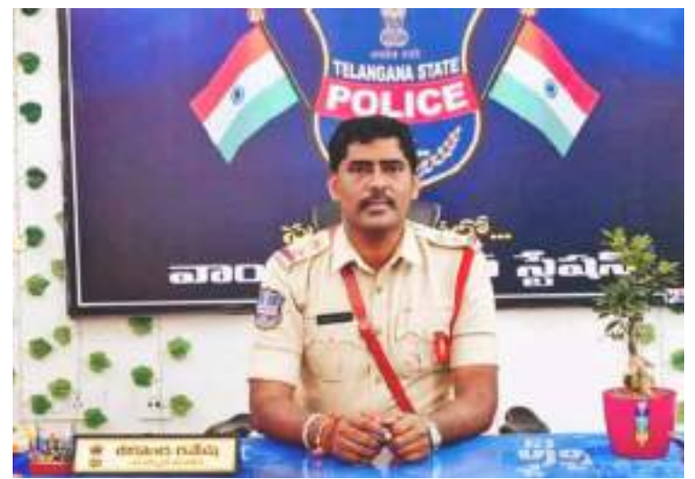
అక్షర విజేత అదిలాబాద్ ప్రతినిధి:-