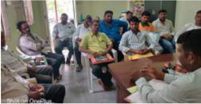
అక్షర విజేత, చార్కొండ: