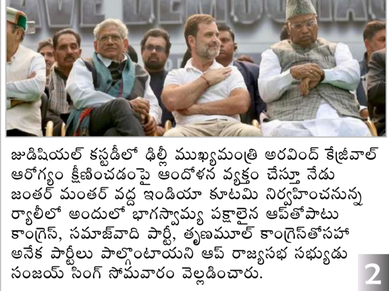
జుడిషియల్ కస్టడిలో ఢిల్లీ ముఖ్యమంత్రి అరవింద్ కేజ్రీవాల్ ఆరోగ్యం క్షీణించడంపై ఆందోళన వ్యక్తం చేస్తూ నేడు జంతర్ మంతర్ వద్ద ఇండియా కూటమి నిర్వహించనున్న ర్యాలీలో అందులో భాగస్వామ్య వక్రాలైన ఆప్తోపాటు కాంగ్రెస్, సమాజ్ వాది పార్టీ, తృణమూల్ కాంగ్రెస్ తో సహా అనేక పార్టీలు పాల్గొంటాయని ఆప్ రాజ్యసభ సభ్యుడు సంజయ్ సింగ్ సోమవారం వెల్లడించారు.