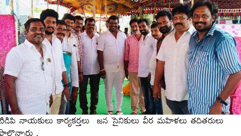
టీడీపీ నాయకులు కార్యకర్తలు జన సైనికులు వీర మహిళలు తదితరులు పాల్గొన్నారు .