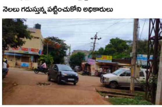
నెలలు గడుస్తున్న వట్టిచుక్కోని లభకారులు