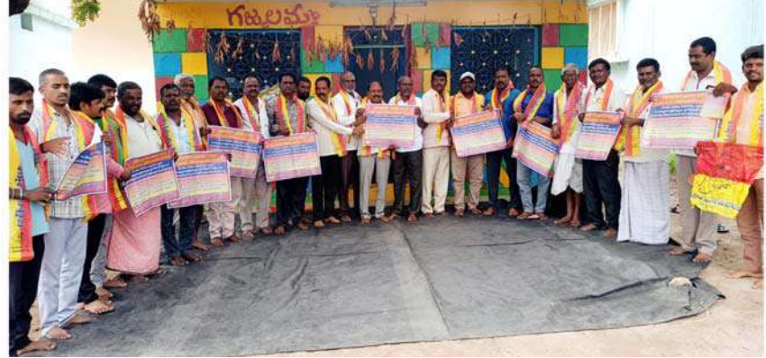
అమరేందర్, తదితరులు పాల్గొన్నారు.