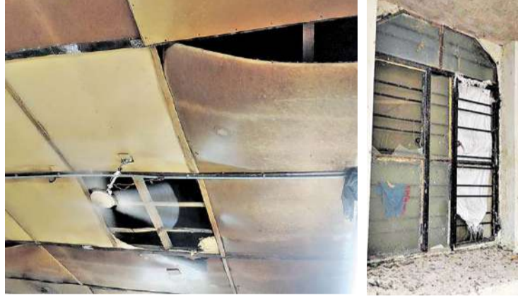
ఓయా ఈ-1 హాస్టల్లో పైకప్పు సీలింగ్ ఇలా.. తెలంగాణ వర్షిటీల్లోని పాత బాలుర హాస్టల్లో అద్దాలు పగిలిపోవడంతో కిటికీకి కట్టిన పరదా

నాసిరకంగా భోజనం.. ఆందోళనలు చేస్తున్నా చర్యలు శూన్యం నిధులు పెద్దగా అవసరం లేని పనులు చేయని అధికారులు బడ్జెట్లో కేటాయింపులే అరకొర.. వాటిలోనూ ఇచ్చేది నామమాత్రమే