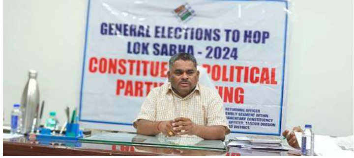
అక్షర విజేత, తాండూరు

వికారాబాద్ జిల్లా కలెక్టర్ ప్రదీప్ జైన్ ఆదేశాల మేరకు ప్రతి సోమవారం తాండూరు ఆర్డీఓ కార్యాలయంలో డివిజన్ సాయి ప్రజావాణి కార్యక్రమం గలదు. అన్ని మండలాల ఎంపీటీవీ కార్యాలయంలో మండల స్థాయి ప్రజావాణి కార్యక్రమం జరుగును. ప్రతి సోమవారం ఇట్టి ప్రజావాణి కార్యక్రమాలు ఇకనుండి యధావిధిగా జరుగును. కావున తాండూరు డివిజన్లోని ప్రజలు ఇట్టి ప్రజావాణి కార్యక్రమాన్ని సద్వినియోగం చేసుకోగలరు. డివిజన్ స్థాయి అధికారులు ఆర్డీవో కార్యాలయంలో పాల్గొనాలి. మండల స్థాయి అన్ని శాఖల అధికారులు మండల స్థాయి ప్రజావాణి కార్యక్రమంలో పాల్గొనాలి. గ్రెగొరియన్ అధికారులపై తగు చర్యలు తీసుకోబడును. సమయం: ఉదయం 10.30 నుండి మధ్యాహ్నం 1:00 వరకు ఫిర్యాదులు స్వీకరణ జరుగుతుందని నియోజకవర్గ ప్రజలు తమ ఫిర్యాదులను చెప్పువచ్చు అన్నారు. ఈ కార్యక్రమంలో అన్ని శాఖల అధికారులు అందుబాటులో ఉంటారని, తాండూరు ఆర్డీఓ యం, శ్రీనివాసరావు ఒక ప్రకటనలో తెలిపారు