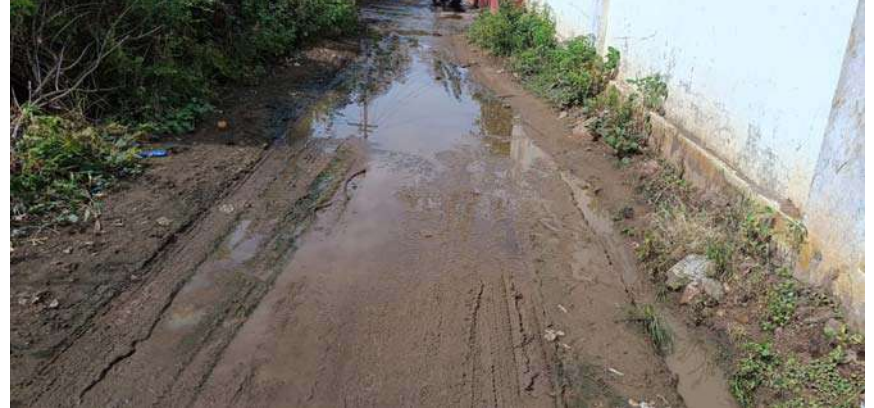
వ్యక్తమవుతుంది. వ్యాధి తీవ్రత పెరుగుతున్నా అంటి ముట్టినట్లుగా పాలన సంబంధిత అధికారులు యంత్రాంగం వ్యవహరించడం పలు రకాల విమర్శలకు తావిస్తోంది. పరిస్థితి విషమించకముందే నివారణ చర్యలపై దృష్టి సారించాల్సి ఉంది.