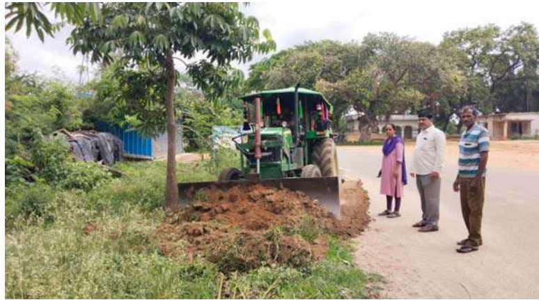
అక్షరవిజేత, టేక్వార్ :

పరిసరాలు పరిశుభ్రతతోనే రోగాలను అరికట్టవచ్చు మండల అభివృద్ధి అధికారి రియాజుద్దీన్