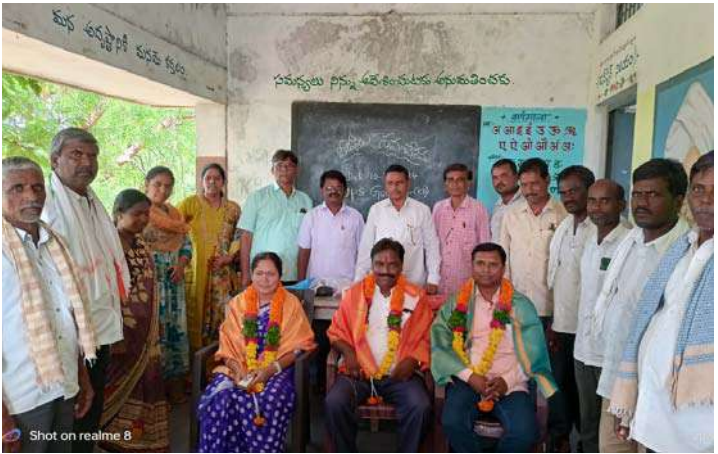
అక్షర విజేత పిట్లం