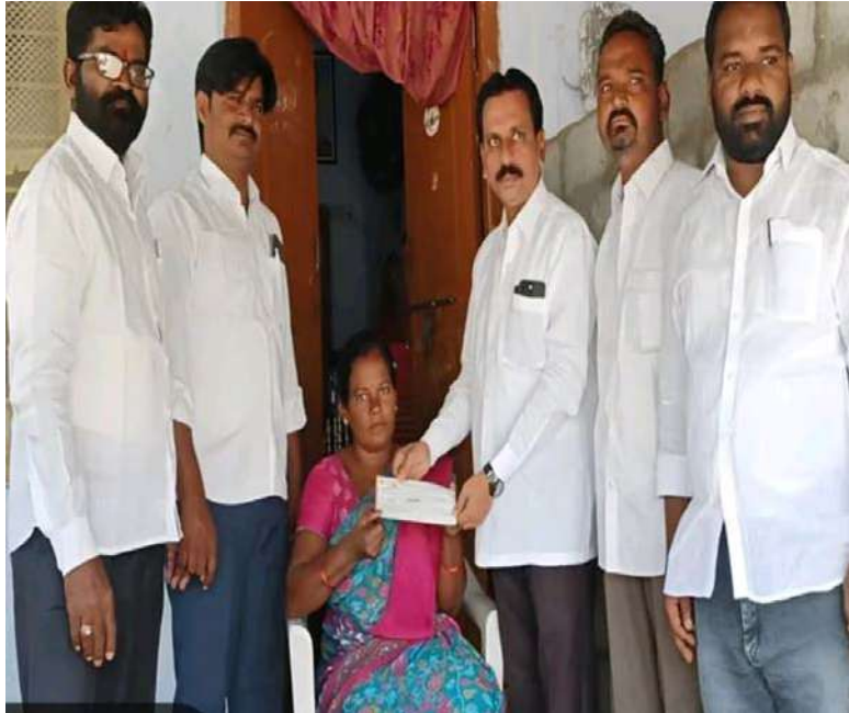
అక్షరవిజేత, దేవరకొండ టౌన్