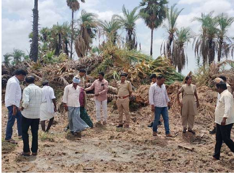
అక్షర విజేత పెట్టేర్

ఈత చెట్లను దుస్వంచేసిన దుండగులను కలిసంగా శిక్షించాలి