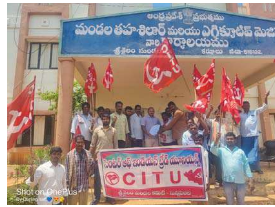
అక్షరవిజేత, శ్రీశైలం ప్రాజెక్టు :