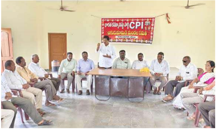
అక్షర విజేత: చిగురుమామిడి