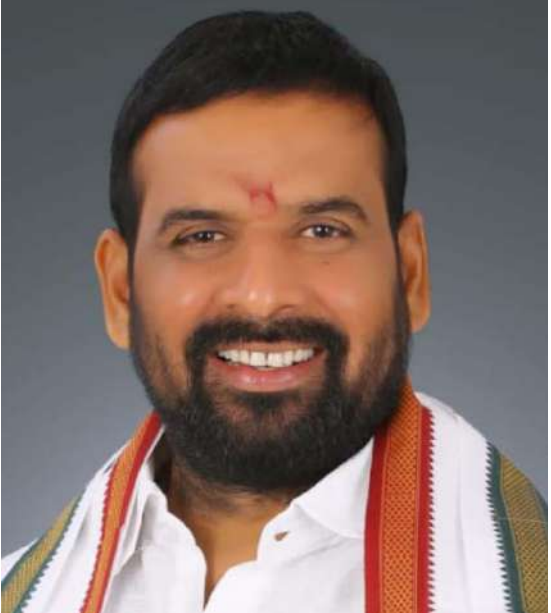
బిఆర్ఎస్ నాయకులు తమ ఉనికి కోసమే ముఖ్యమంత్రి రేవంత్ రెడ్డి పై అసభ్యకరమైన భాష మాట్లాడుతున్నారని అన్నారు. రాష్ట్ర ప్రజల సంక్షేమం కోసం రోజు 18 గంటలు పనిచేస్తున్న ముఖ్యమంత్రి రేవంత్ రెడ్డి అని, అలాంటి వ్యక్తిపై విమర్శలు చేసిన ప్రజలు సమ్మే పరిస్థితి లేదని ఆయన తెలిపారు.

మూసీ నదిలో ఇసుక క్రాకర్ల లకు కమిషన్ తీసుకున్న చరిత్ర కిషోర్ ది అని ఆయన విమర్శించారు. 10 ఏళ్లు అధికారంలో ఉన్న కేసీఆర్ ఒక్క డీఎస్సీ వేయలేదని ఈరోజు నిరుద్యోగ యువతను ప్రలోభాలకు గురి చేస్తూ ముసలి కన్నీరు కారుస్తున్నారని ఆయన అన్నారు. తెలంగాణ నిరుద్యోగ యువతకు రాష్ట్రంలోని కాంగ్రెస్ ప్రభుత్వం ముఖ్యమంత్రి రేవంత్ రెడ్డి అండగా ఉంటారని ఎన్నికల్లో మాట ఇచ్చిన విధంగా టెట్ నిర్వహించి డీఎస్సీ వేయడం జరిగిందని త్వరలో జాబ్ క్యాలెండర్ ప్రకటించడం జరుగుతుందని తెలిపారు.