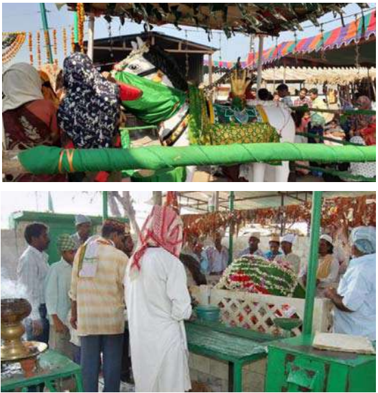
కాంట్రాక్టర్ మాత్రం ముజావర్ల ద్వారా అక్కడ పాలన సాగిస్తున్నట్లు స్థానికులు ఆరోపిస్తున్నారు. వారు చెప్పిందే నడువాలని, అడిగిందే ఇవ్వాలన్న నూత్రాన్ని అమలు చేస్తున్నారు. అక్కడ భక్తులు కాసుకలు, డబ్బులు ఇవ్వకపోతే ముజావర్లు దర్శనం చేసుకోనివ్వడం లేదని లేకపోతే భౌతికదాడులు చేస్తున్నారని భక్తులు వాపోతున్నారు. ప్రత్యేక రోజుల్లో దోపిడి పరాకాష్ఠగా మారుతుందని వాపోతున్నారు. వక్స్ బోర్డు అధికారులు దానిని పరిశీలన చేయకుండానే గుడ్డిగా గత కాంట్రాక్టర్లను సమ్మి దర్గా నిర్వాహణను అప్పజెప్పారని భక్తులు వాపోతున్నారు. ఈ విషయంపై వక్స్ బోర్డు అధికారులు కు ఫిర్యాదు చేసినట్లు చెబుతున్నారు.

ఉద్యోగులూ అంటే కాదు కేవలం వక్స్ బోర్డు తరపున నియమించబడిన వారు. వారు ప్రతి శుక్ర, ఆదివారాల్లో దర్గాకు వచ్చే వారిని నిట్టనిలుపునా దోపిడి చేస్తున్నారు. ప్రతీసారి అక్కడ ప్రభుత్వం నియమించే కాంట్రాక్టర్లు దర్గా నిర్వాహణ చూస్తుండగా ఎన్నికల కోడ్ కారణంగా కొత్త కాంట్రాక్టర్ కు దర్గాను కేటాయించకపోవడంతో ముజావర్ల దోపిడి కొనసాగుతుంది. ప్రధానంగా వక్స్ బోర్డు ఆధీనంలో ఉన్న దర్గాలో వక్స్ బోర్డు అధికారులు, ముజావర్లు కుమ్ముక్కు అక్కడ జరుగుతున్న దోపిడిని అరికట్టలేకపోతున్నారు. అక్కడ ముజావర్ల ప్రైవేట్ సైన్యం ఆధీనంలోనే దర్గాతో పాటు అక్కడ అద్దె గదులు లభిస్తాయి. అద్దె గదుల ధరలు కూడా హెూటళ్లు గదుల ధరలకు ఏ మాత్రం తీసిపోవడం లేదు. రేకుల గదులకు పెద్ద మొత్తంలో డబ్బులు వసూల్ జరుగుతుంది. దర్గాలో దర్శనం కోసం వచ్చే వారు ముజావర్లు వేదించడం పరిపాటిగా మారింది. 2023 ఏప్రిల్ 15 నుంచి 2024 ఏప్రిల్ 16 వరకు గతంలో బెందర్ ను కొందరు దక్కించుకున్నారు. రూ.3 కోట్ల 45 లక్షలు వక్స్ బోర్డుకు చెల్లించిన వారికి బెందర్ ను అప్పగించారు. 2024 ఏప్రిల్ 17 నుంచి వక్స్ బోర్డు ఆధీనంలో బదాపహాద్ దర్గా ఉంది. అయితే 2024 జూన్ 24న బదా పహాద్ ఆలయ హుండిని లెక్కించగా అందులో 20 లక్షల 93 వేల 860 సగదు ఉండగా, బంగారం, వెండి కాసుకల ద్వారా 39 వేలు వచ్చినట్లు వక్స్ బోర్డు అధికారులు తెలిపారు. అయితే బెందర్ ముగిసినప్పటికి