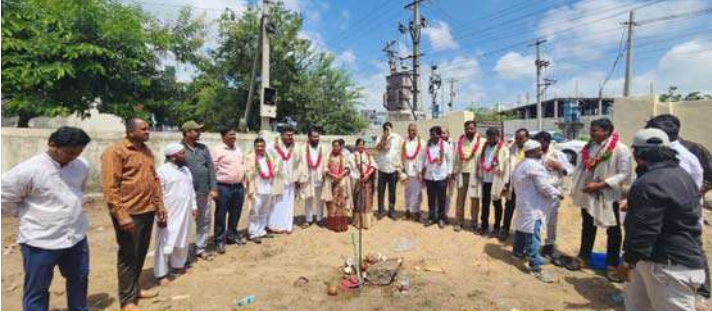
అక్షర విజేత రాజేంద్రనగర్