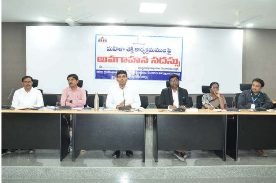
అక్షర విజేత సిద్దిపేట