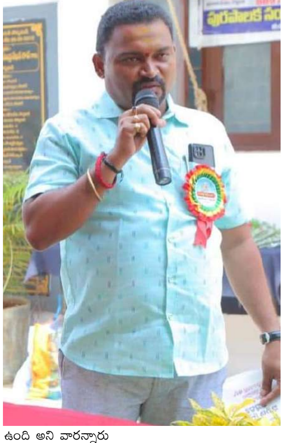
ఉంది అని వారన్నారు

రూపొందించుటకు సభ్యులకు సంబంధం లేకుండానే, కౌన్సిల్ సభ్యుల యొక్క వినతిని స్వీకరించుటకు ఇక్కడ ఆస్కారమే లేదని మున్సిపల్ చైర్ పర్సన్ తన ఇష్టానికి మాత్రమే తన సొంత ఎజెండా రూపొందించబడి ఇంప్లిమెంటేషన్ చేస్తున్నారని, నిజంగా కాపీని సభ్యులకు కాపీ కూడా ఇచ్చే పరిస్థితి లేదని, ఈ సందర్భంగా వారు అన్నారు, ఎ ఒక్క మున్సిపల్ సమావేశం ప్రజా సమస్యలపై చోరాలం చేసి గెలిపించిన ప్రజలకు న్యాయం చేసే పరిస్థితులలో లేవని ఇంతటి నియంత మున్సిపల్ పరిపాలన చొప్పదండి మున్సిపాలిటీకి చెల్లించని కనీసం సాధారణ సమావేశంలో గౌరవ సభ్యులకు నీళ్ల బాటిల్ ఇచ్చే దుస్థితిలో కూడా కౌన్సిల్ లేదని, ఈ సందర్భంగా వారు అన్నారు. జిల్లాలో డెంగ్యూ కేసులు విపరీతంగా పెరుగుతున్న మరియు శివారు ప్రాంతాలలో రోడ్లు సరిగా లేక మొరం పోయిందే దుస్థితిలో కూడా మున్సిపల్ వారు లేరని ఎన్నిసార్లు లిఖితపూర్వకంగా రాసి ఇచ్చిన పట్టించుకునే నాధుడే లేదని వారన్నారు. సెంట్రల్ లైటింగ్ పనులలో నాణ్యత లోపించి సరైన సూచికలు ఏర్పాటు చేయకపోవడం వలన జాగ్రత్తలు పాటించకపోవడం వలన అనేక రోడ్లు ప్రమాదాలు జరిగినప్పటికీ ఇప్పటికీ కౌన్సిల్ సమావేశంలో కానీ చైర్పర్సన్ మున్సిపల్ అధికారులు కనీసం దానిపైన ఆలోచన చేయకపోవడం విద్వరంగా