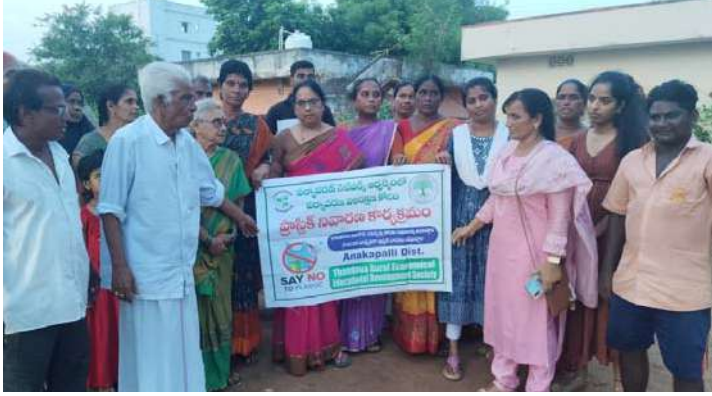
అక్షర విజేత కోటనందూరు.