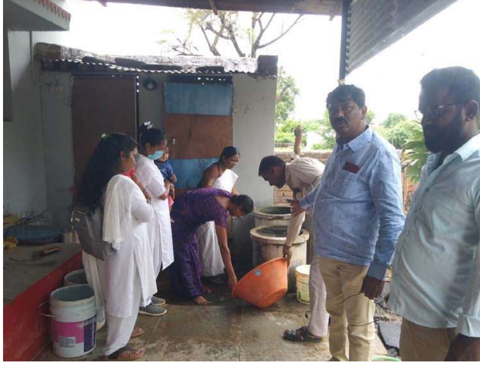
అక్షర విజేత పిట్లం.