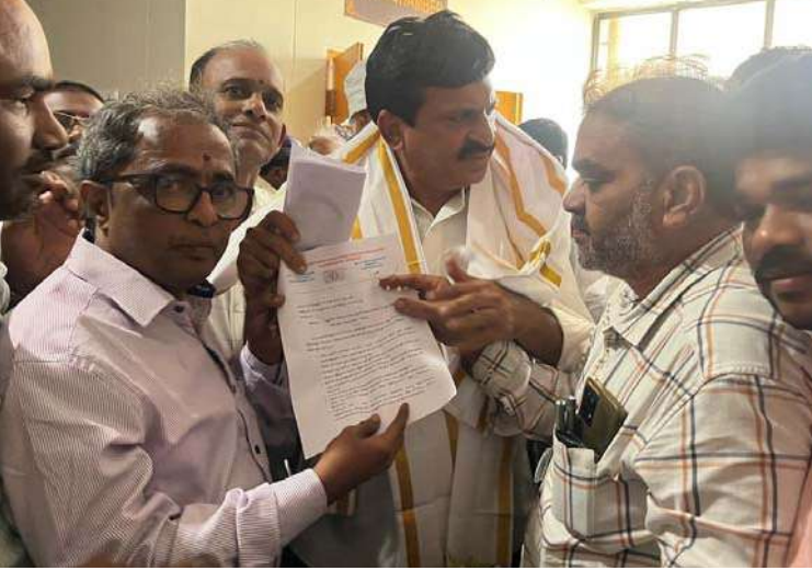
అక్షర విజేత వనపర్తి ప్రతినిధి

తెలంగాణ రాష్ట్ర రెవెన్యూ శాఖ మంత్రి పొంగులేటి శ్రీనివాసరెడ్డి