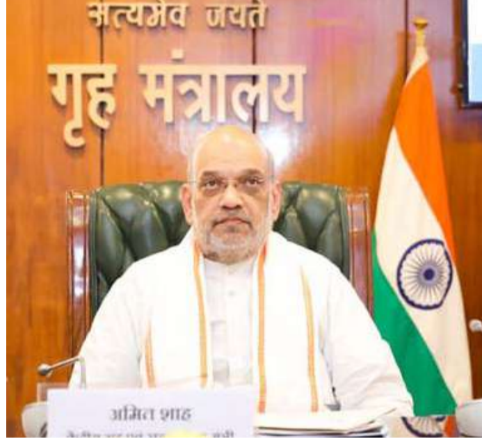
అమిత్ షా మాట్లాడుతున్న చిత్రం.

కేంద్ర ప్రభుత్వం కీలక నిర్ణయం తీసుకుంది. దాదాపు 50 ఏళ్ల క్రితం దేశంలో అత్యయిక స్థితి (%జుఎవతీప్రవఅఎఎ%)ని విధించిన జూన్ 25వ తేదీని ‘రాజ్యాంగ హత్యా దినం (%ట్రుఎజఅసప్టుఅ న్ఘ్ఘు ణఅఘ్ఘు%)’గా ప్రకటించింది. ఈ మేరకు కేంద్రం శుక్రవారం గెజిట్ నోటిఫికేషన్ విడుదల చేసింది. ఈ విషయాన్ని హెంజు మంత్రి అమిత్ షా ‘ఎక్స్’ వేదికగా వెల్లడించారు. ‘1975 జూన్ 25న అప్పటి ప్రధాని ఇందిరాగాంధీ తన నియంతృత్వ పాలనతో దేశంలో అత్యయిక స్థితి విధించి ప్రజాస్వామ్యం గొంతు సులిమేశారు. ఎలాంటి కారణం లేకుండా లక్షలాది మందిని జైల్లో పెట్టారు. మీడియా గణాన్ని అణగారొక్కారు. ఆ చీకటి రోజులకు నిరసనగా ఇక నుంచి ఏటా జూన్ 25ను ‘సంవిధాన్ హత్య దినం’గా నిర్వహించాలని నిర్ణయించాం. ఎమర్జెన్సీ సమయంలో ప్రజలు అనుభవించిన వేదనను, హైద్రాబాద్ ఆక్రమణలపై ఉక్కు