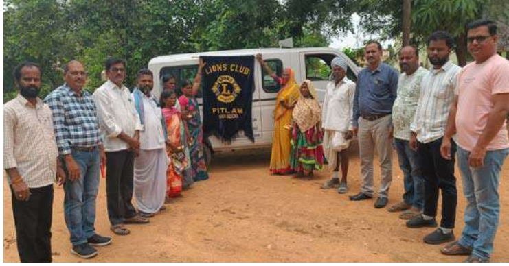
అక్షర విజేత పిట్లం.