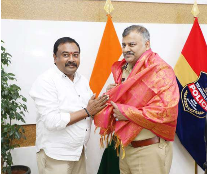
అక్షర విజేత, కొమరవెల్లి: