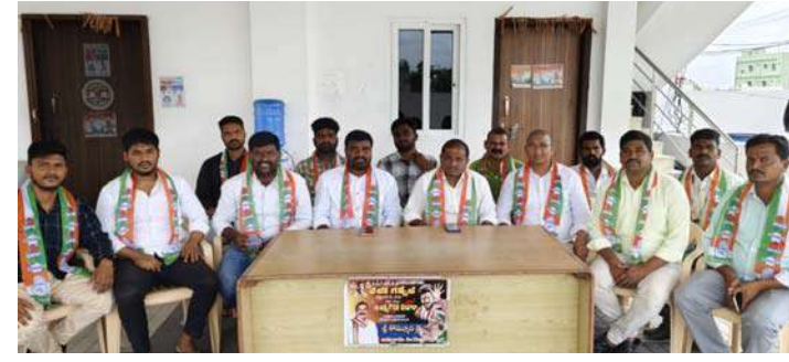
అక్షర విజేత, కొమరవెల్లి: