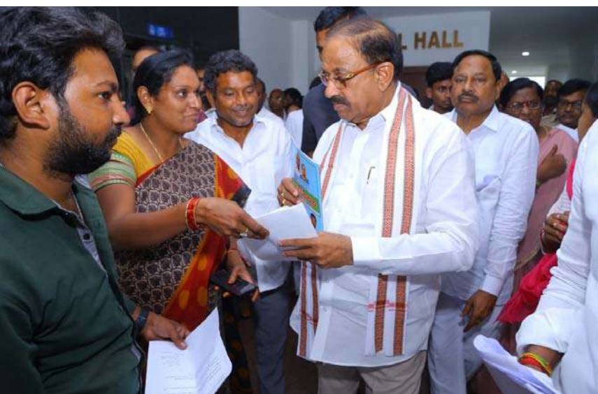
01/1967/ అడ్డబ్యా/0807 తేది: 12-09-2006న నోటీసు యిచ్చియున్నారు . అట్టి నోటీసును ప్రజలు అందరూ అంగీకరించి సదరు రోడ్డుకు ఇష్టపూర్వకముగా సంతకములు చేసియున్నారు . టౌన్ ప్లానింగ్ వారు వారు గత కొన్నిరోజుల క్రితం మార్కింగ్ చేసియున్నారు . కావున తమరు సదరు విషయమును పరిశీలించి రి క్కబజార్ నుండి ముఖ్యమంత్రి గుడి సెంటర్ వరకు 33 అడుగుల మార్గం ప్లాన్ రోడ్డును వెడల్పు చేయగలరని కోరుచున్నాము.