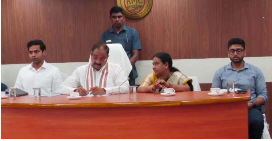
అక్షర విజేత ఖమ్మం టౌన్ :-