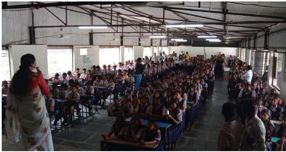
అక్షర విజేత చిలకలూరిపేట