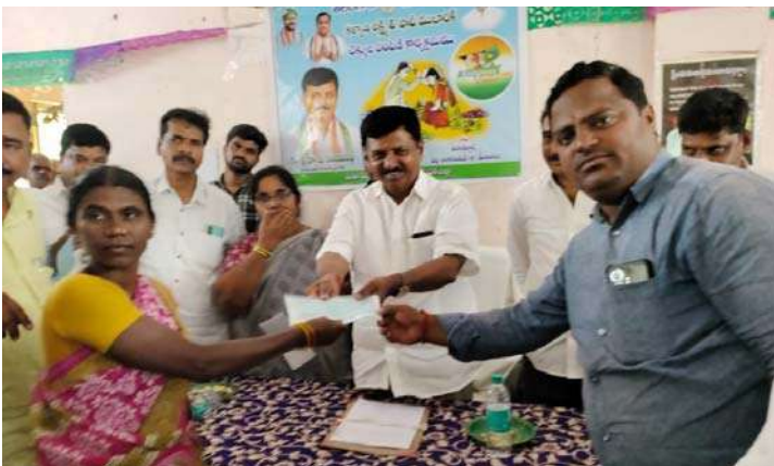
అక్షర విజేత, పెద్ద శంకరంపేట్: