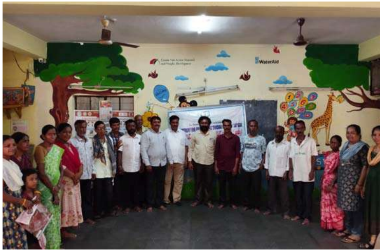
అక్షర విజేత , హైదరాబాద్ ప్రతినిధి:

మత్తు పదార్థాలకు బానిసై తమ జీవితాలను నాశనం చేసుకోవద్దు.