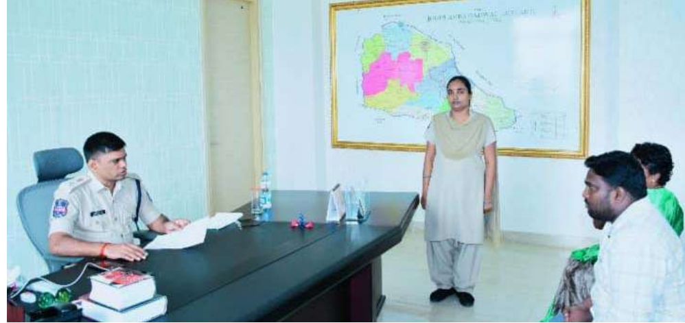
అక్షర విజేత గద్వాల జిల్లా 1/