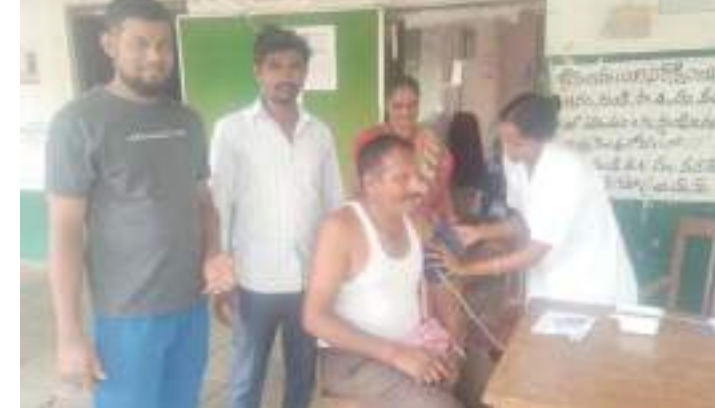
అక్షర విజేత మల్కాల కొండగట్టు