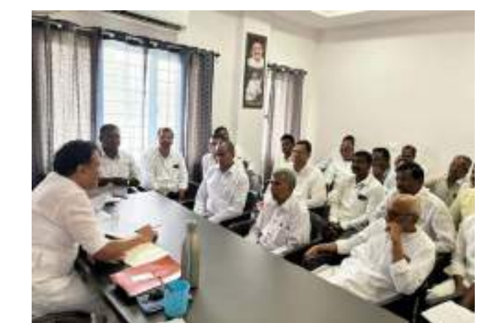
అక్షర విజేత నిజాంసాగర్

ఈరోజు ఎమ్మెల్యే క్యాంప్ కార్యాలయంలో బిమ్మండ, మద్నూర్, జుక్కల్ మండల స్థాయి నాయకులతో సమీక్షా సమావేశాలు నిర్వహించిన జుక్కల్ ఎమ్మెల్యే తోట లక్ష్మీ కాంతారావు ఈ సమీక్షా సమావేశాలలో పార్టీ యొక్క నిర్మాణం మరియు సమస్యల పట్ల చర్చించారు.. క్షేత్ర స్థాయిలో కాంగ్రెస్ పార్టీని బలోపేతం చేసి రాజీయే స్థానిక సంస్థల ఎన్నికలలో పార్టీ అభ్యర్థుల గెలుపే లక్ష్యంగా ప్రణాళికలతో పనిచేయాలని నాయకులకు దిశా నిర్దేశం చేశారు ప్రభుత్వం పేదలకు అందిస్తున్న సంక్షేమ పథకాలను అర్హులందరికీ అందించే విధంగా కృషి చేయాలని చెప్పారు పార్టీ కార్యక్రమాలలో చురుకైన పాల్గొనే విధంగా కార్యకర్తలను ప్రోత్సహించాలని, పార్టీ కోసం కష్టపడే కార్యకర్తలకు తగిన గుర్తింపు, గౌరవం ఇవ్వాలని బాధ్యత అందరిపై ఉందని అన్నారు..