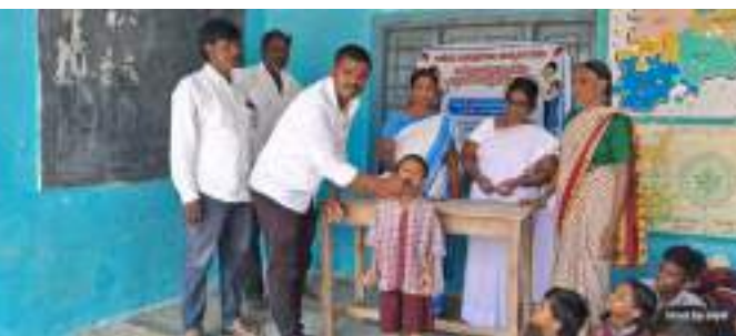
అక్షర విజేత నిజాంసాగర్

కామారెడ్డి జిల్లా నిజాం సాగర్ మండల కేంద్రంలోని మండల్ ఆనంద్ బి గ్రామ పాఠశాలలో చిన్నపిల్లలకు జాతీయ నులిపురుగుల నివారణ దినోత్సవం పురస్కరించుకొని 1-19 సంవత్సరాల వయసు గల చిన్నారులకు, విద్యార్థులకు యందు ఏర్పడు చేయబడినది. జాతీయ నులి పురుగుల ప్రారంభించారు. ఈ సందర్భంగా నూలు పురుగుల వలన జరిగే నష్టాలను తెలియపరుస్తూ వాటి నివారణకు తీసుకోవలసిన జాగ్రత్తలు వివరించడం జరిగింది. నులి పురుగుల పిల్లలకు సోకే దీని ద్వారా కడుపు నొప్పు నూలి పురుగుల మన యొక్క పేగు గోడలకు అంటుకొని చిన్నపిల్లలకు తిండి జీర్ణం కాకుండా రక్తపీసతలు మరియు విపరీతమైన కడుపునొప్పి వాంతులు విరోచనాలు కలిగి పిల్లలను ఆరోగ్యంగా ఉంచుతుంది ఈ కార్యక్రమంలో ఆశ వర్కర్లు స్కూల్ టీచర్లు పాల్గొన్నారు