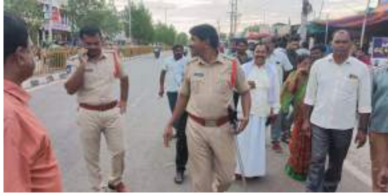
అక్షరవిజేత, దేవరకొండ టౌన్