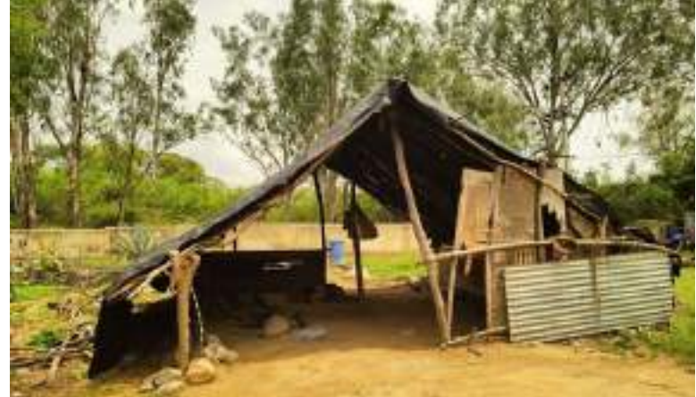
అక్షర విజేత నిజాంసాగర్

కామారెడ్డి జిల్లా నిజాంసాగర్ మండలం అచ్చంపేట్ గ్రామ పరిధిలో ఉన్న ఆదర్శ పాఠశాల ప్రభుత్వం పాఠశాలలో దీటుగా తెలంగాణ రాష్ట్రంలో ప్రభుత్వ పాఠశాలలను తీర్చిదిద్దడామని గత గులాబీ పాలకులు, ప్రస్తుత కాంగ్రెస్ పాలకులు వేదికలపై గొప్పగా ప్రకటిస్తున్నప్పటికీ క్షేత్రస్థాయిలో అమలు కాక పేద విద్యార్థులకు ప్రభుత్వ విద్య అందని ద్రాక్షగా మారుతుంది. తెలంగాణ రాష్ట్రం ఏర్పాటు కాకముందు రాష్ట్రంలో కొన్నిచోట్ల ప్రభుత్వ పాఠశాలలు, జూనియర్ కళాశాలలు, డిగ్రీ కళాశాల ఉండేవి. తెలంగాణ రాష్ట్రం ఏర్పాటైన తర్వాత గత ముఖ్యమంత్రి చంద్రశేఖర రావు ప్రత్యేకంగా విద్యపై దృష్టి పెట్టి ఆర్థిక సోమత లేక బడి బయట ఉన్న బాలికలను పాఠశాలలో జరిపించి వారికి ఉన్నత చదువులు చదివించడానికి ప్రతి మండల కేంద్రంలో కస్తూర్బా బాలికల పాఠశాలను నెలకొల్పారు. దీంతోపాటు గురుకుల పాఠశాలలు, ఆదర్శ పాఠశాలలు ఏర్పాటు చేసి పేద విద్యార్థులకు నాణ్యమైన విద్యతో పాటు, పౌష్టికాహారం అందించడానికి ఈ పాఠశాలలో నెలకొల్పారు . ప్రభుత్వ ఉద్దేశం మంచిదైనప్పటికీ కొంతమంది అధికారుల నిర్లక్ష్యం, పాలకుల నిర్లక్ష్యం వల్ల నిరుపేదలకు సరైన విద్య, పౌష్టికాహారం అందక విద్యార్థులు అనారోగ్యం బారిన పడుతున్నారు. ఇటీవల వైద్యాధికారులు పలు కస్తూర్బా పాఠశాలలో, వసతి గృహాలు, గురుకుల పాఠశాలలో, ఆదర్శ పాఠశాల లో వైద్య పరీక్షలు నిర్వహించగా చాలామంది రక్తహీనత తో బాధపడుతున్నట్లు వైద్యుల పరీక్షలో తేలింది . సరియైన నాణ్యమైన పౌష్టికాహారం అందక ప్రభుత్వ వసతి గృహాల్లో బాల బాలికలకు రక్తహీనత, ఐరన్ లోపం, పలు వ్యాధుల బారిన పడుతున్నట్లు తేలింది. కానీ అధికారులు