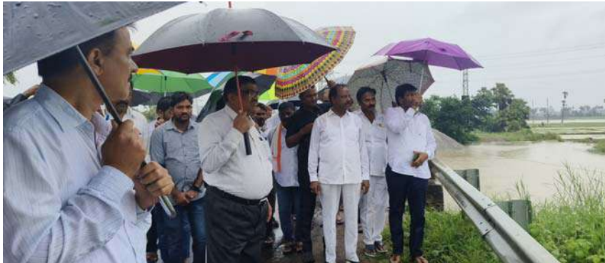
పెరుగుతూ ఉందని నీటిమట్టం పెరిగితే తీసుకోవాల్సిన జాగ్రత్తలపై అధికారులు అప్రమత్తతో ఉండాలని ఆదేశించారు. గణపసముద్రం చెరువు ద్వారా సాగుతున్న ఆయకట్టు రైతులను అప్రమత్తం చేయాలని సూచించారు.