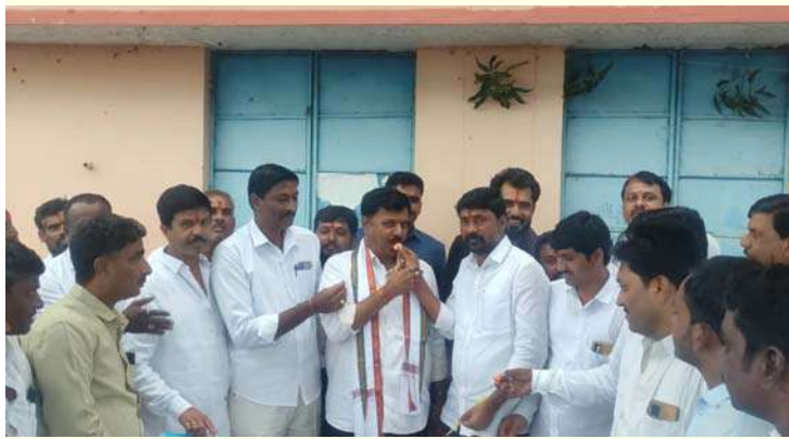
అక్షర విజేత సంగారెడ్డి జిల్లా నారాయణఖేడ్.