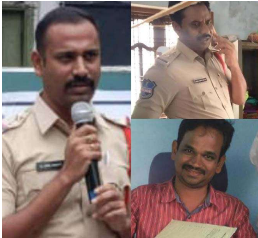
కార్యదర్శులకు గాని ఫోన్ ద్వారా విన్నవించాలని, వెంటనే సంబంధిత అధికారులు వచ్చి సమస్యను పరిష్కరిస్తారని అన్నారు. అంతేకాకుండా పాత ఇల్లు, శిథిలవస్తక కూలిపోయే అవకాశాలు ఉంటే, వెంటనే ప్రభుత్వ పాఠశాలల్లో గాని, సంబంధిత అంగన్నాడి కేంద్రంలో గాని నివాస ఉండాలని వారు కోరారు.