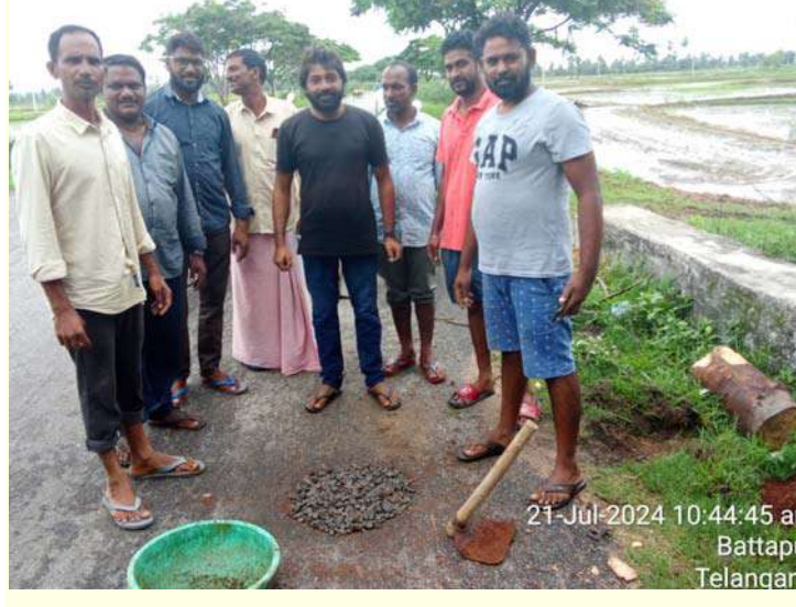
21-Jul-2024 10:44:45 a Bhattap Telangar