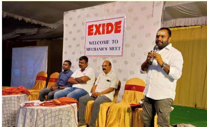
అక్షరవిజేత, వికారాబాద్ ప్రతినిధి