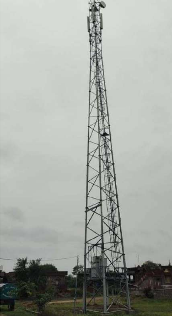
విస్తూయం వ్యక్తం చేశారు. దీంతో గ్రామ పంచాయతీ కి చాలా నష్టం జరుగుతుందని అభిప్రాయం వ్యక్తం చేశారు. అంతే కాకుండా జనజీవన వ్యవస్థ మీద ప్రభావం చూపే ఈ సెల్ టవర్ పై చర్యలు తీసుకోవాలని