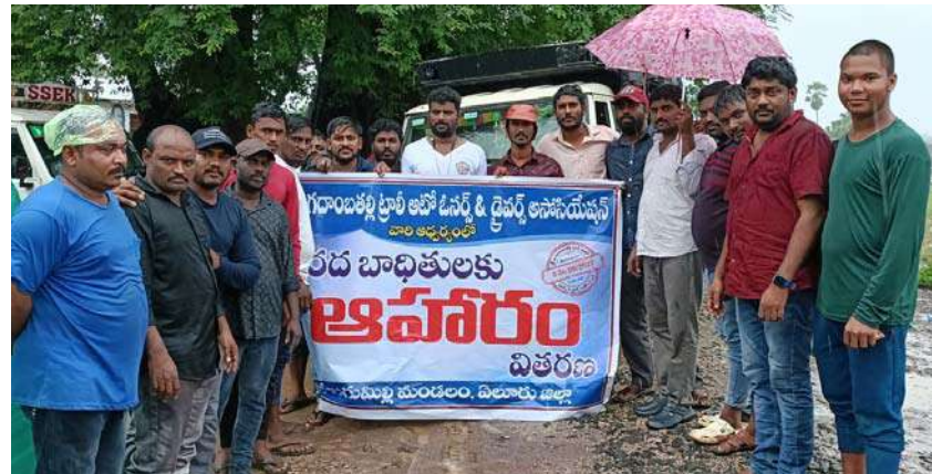
అక్షర విజేత జీలుగుమిల్లి