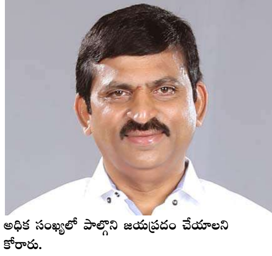
అధిక సంఖ్యలో పాల్గొని జయప్రదం చేయాలని కోరారు.