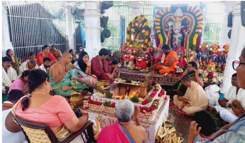
అక్షర విజేత, పాపస్మేష

-వైభవంగా శ్రీ గురుదత్త యగనహిత శక్తి పంచాయతన పూర్వక వనదుర్గా మహా విద్యా యజ్ఞ-యాగములు -భారీగా భక్తిశ్రద్ధలతో పాల్గొన్న భక్తులు