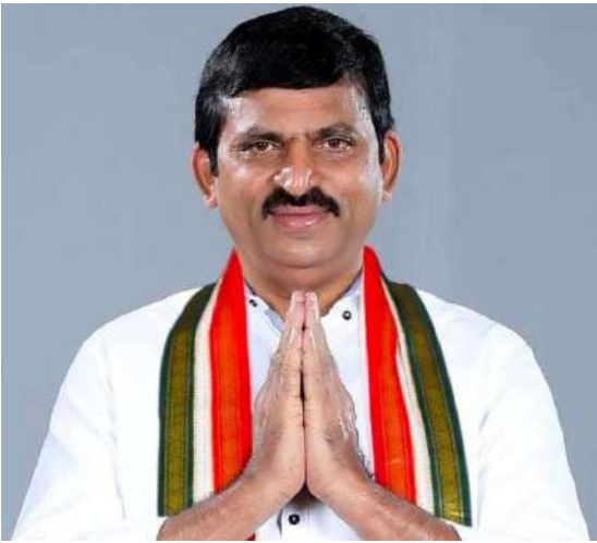
అధిక సంఖ్యలో పాల్గొని జయప్రదం చేయాలని కోరారు.