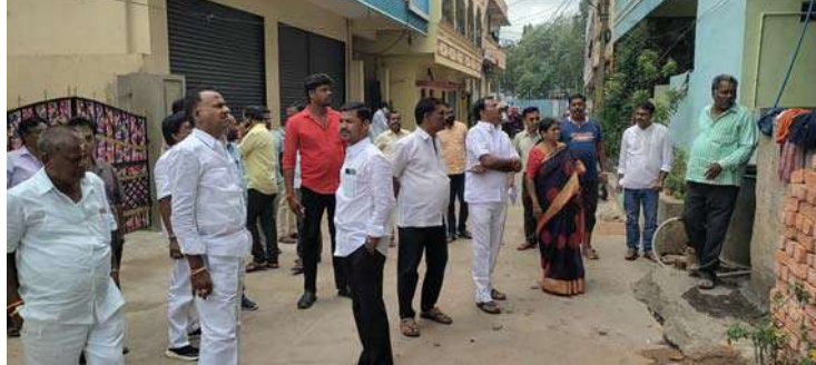
అక్షర విజేత పటాన్చెరు