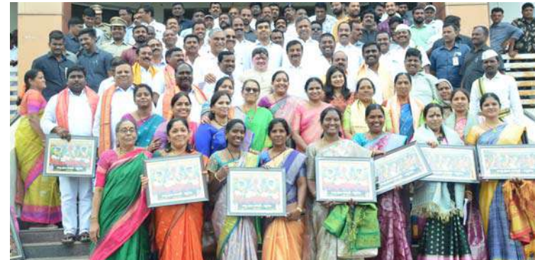
అక్షర విజేత సిద్దిపేట