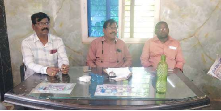
అక్షర విజేత కామారెడ్డి బ్యూరో