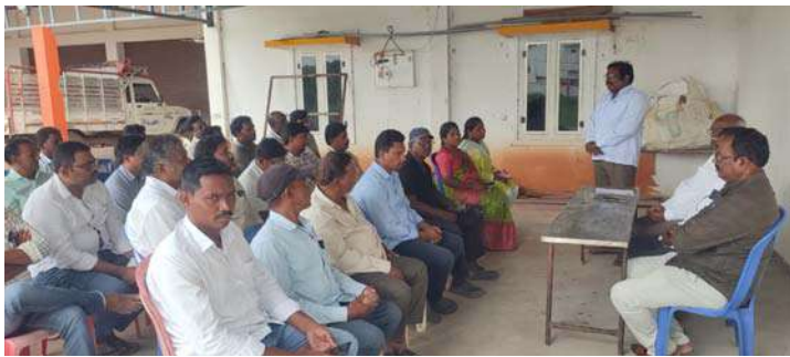
అక్షర విజేత ఎర్రపాతం: