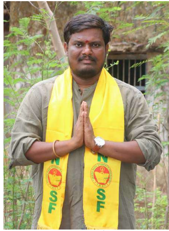
ఇప్పటివరకు ఎవరికి అవగాహన లేదు ఇప్పటికైనా ప్రభుత్వం ఈ విద్యాహక్కు చట్టం పైన విద్యార్థులు తల్లిదండ్రులకు అవగాహన కల్పించాలని తెలుగునాడు విద్యార్థుల సంఘం తరపున నేను ప్రభుత్వాన్ని కోరుతున్నాను....!

విద్యార్థులకు సీట్లను కేటాయించవలసి ఉంది ఈ యొక్క నిబంధనను ఏ ఒక్క ప్రైవేట్ పాఠశాలలు కూడా పాటించడం లేదు.. దీనికి ముఖ్య కారణం విద్యా హక్కు చట్టంలో ఉన్నటువంటి ఈ నిబంధన పైన విద్యార్థుల యొక్క తల్లిదండ్రులకు పూర్తిగా అవగాహన లేకపోవడమే ముఖ్య కారణం... 25% సీట్లలో కేవలం ఒకటవ తరగతిలో మాత్రమే ప్రవేశాలకు అనుమతి ఉంది ఒకసారి ఒకటో తరగతిలో జాయిన్ అయినటువంటి విద్యార్థి కొన్ని సంవత్సరాల వరకు అందులో ఉచితంగానే విద్యను అభ్యసించవలసి ఉంది..కానీ విద్యార్థులకు వారి యొక్క తల్లిదండ్రులకి ఈ యొక్క నిబంధన పైన ప్రభుత్వం ఎలాంటి అవగాహన కల్పించడం లేదు కావున అవకాశముంది కూడా విద్యార్థులు వారి యొక్క ఉచితంగా చదువుకునే హక్కును కోల్పోతున్నారు...! ఇలా ముందుగా కార్పొరేట్ పాఠశాలలో చదువుకోవాలనుకునే నిరుపేద విద్యార్థులు గవర్నమెంట్ ఉన్నటువంటి వెబ్సైట్ ద్వారా వారి యొక్క వివరాలను అందులో పొందుపరచుకోవాలి తరువాత వారికి వారి పరిధిలో ఉన్నటువంటి పాఠశాలల యొక్క పేర్లను ఆ వెబ్సైట్ చూపిస్తుంది. అందులో మీకు నచ్చినటువంటి పాఠశాలల యొక్క పేర్లను ఎంచుకోవాలి ఉంటుంది అందులో ద్రా పర్మిట్ ద్వారా మీకు పాఠశాలను ప్రభుత్వం కేటాయిస్తుంది పాఠశాలను కేటాయించిన ప్రభుత్వం వారికి ఉచితంగానే వారి యొక్క విద్యను అభ్యసించవలసిందిగా నిబంధన ప్రకారం సూచిస్తుంది....! ఈ చట్టం వచ్చి చాలా సంవత్సరాలు అయినప్పటికీ