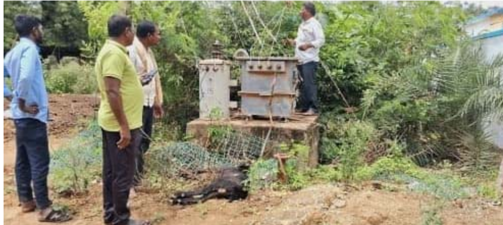
అక్షర విజేత సంగారెడ్డి జిల్లా ప్రతినిధి:

పాఠశాల పక్కన ఉన్న ట్రాన్స్ఫార్మర్ విద్యుత్ షాక్ వల్ల రెండు మేకలు మృతి మేకల మృతి తో ఆర్థిక నష్టం బోరున విలపించిన మేకల పెంపకం దారుడు రిస్క్ లో ప్రభుత్వ పాఠశాలలో చదివే పిల్లల ప్రాణాలు వేరే చోటుకు తలించాలని స్థానికులు డిమాండ్