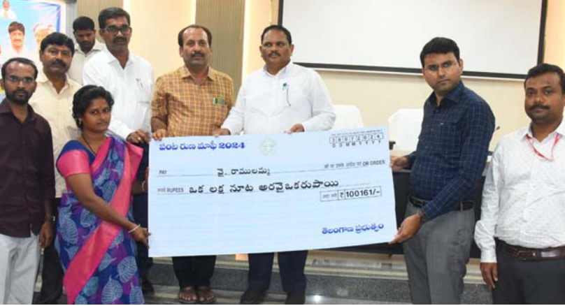
అక్షర విజేత జోగులాంబ గద్దాల ప్రతినిధి