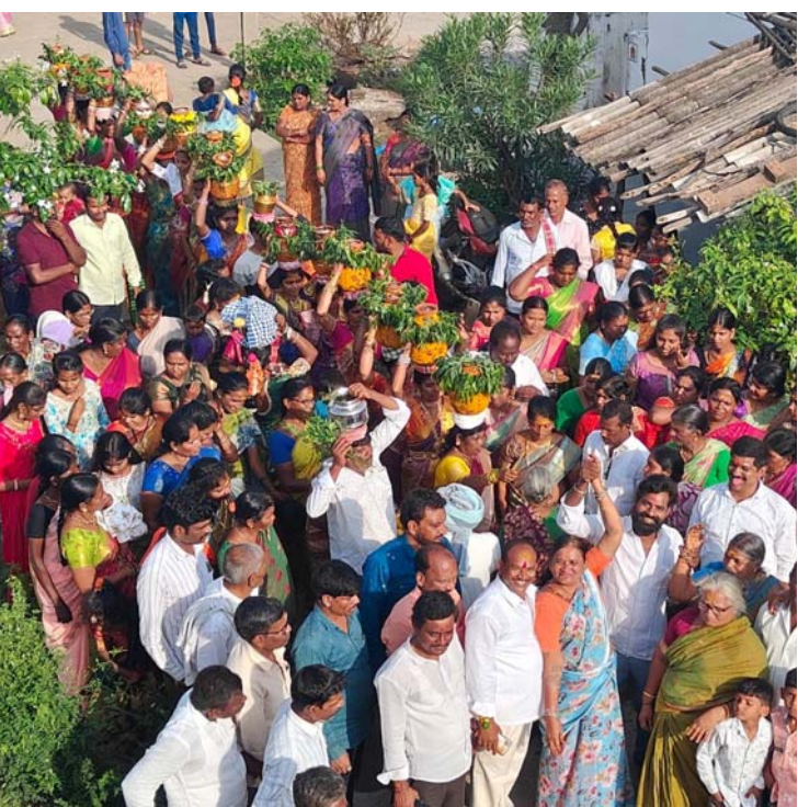
అక్షర విజేత కోటనందూరు.