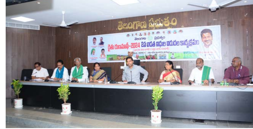
అక్షర విజేత ఖమ్మం టౌన్ :-