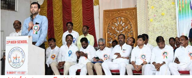
అక్షర విజేత, వికారాబాద్ ప్రతినీధి