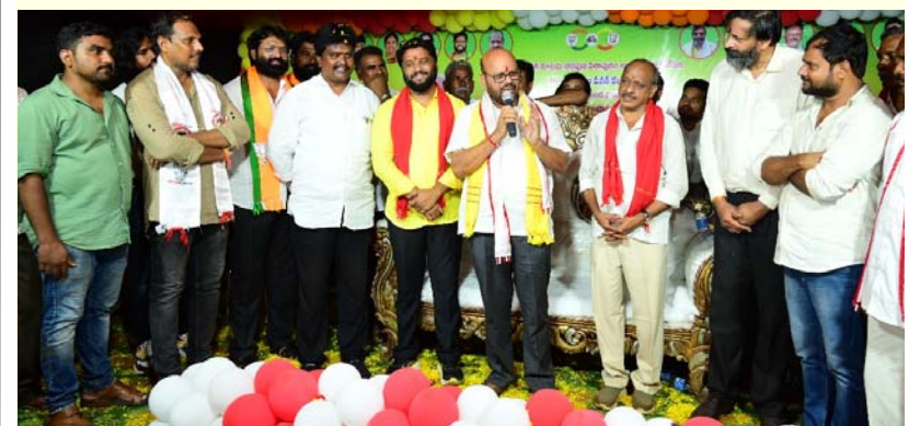
అక్షర విజేత, గోపాలపురం.