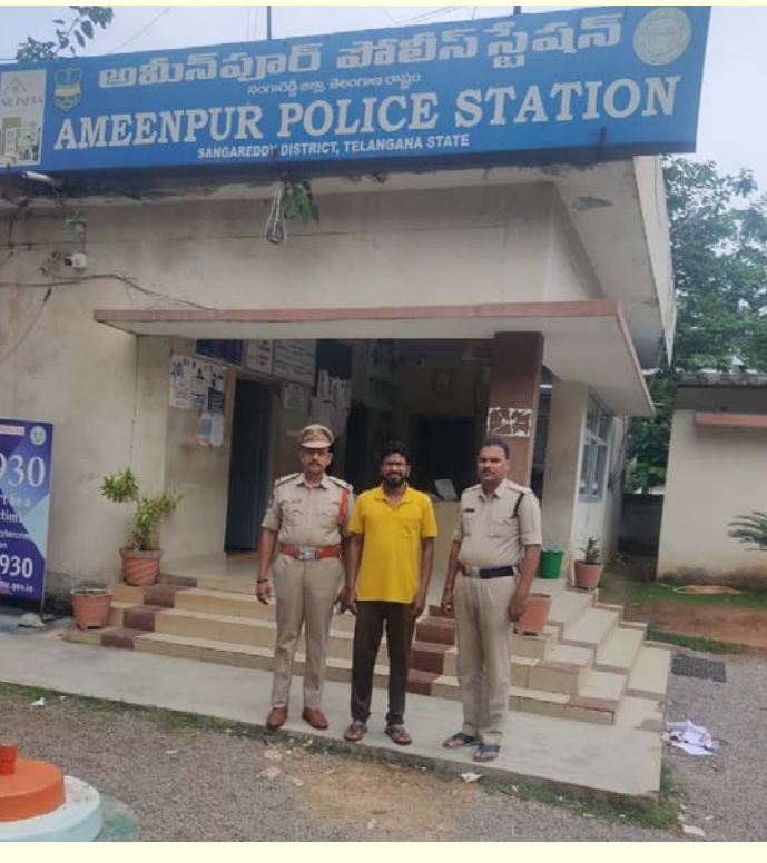
అక్షర విజేత సంగారెడ్డి జిల్లా ప్రతినిధి