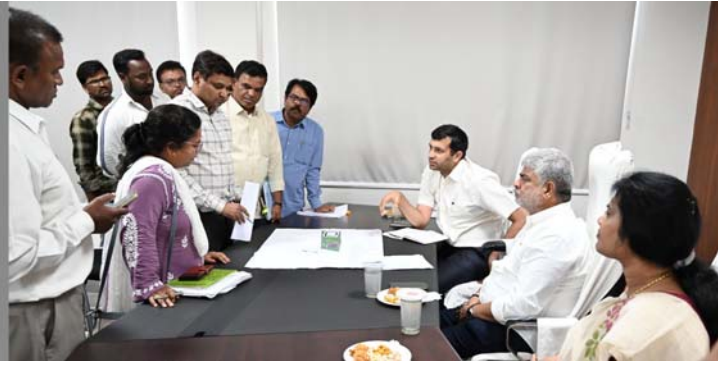
అక్షర విజేత, వికారాబాద్ ప్రతినిధి