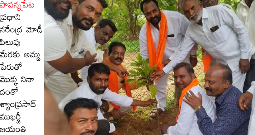
అక్షర విజేత, పాపన్నపేట