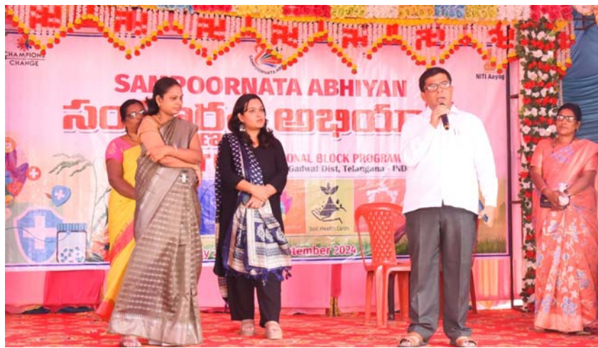
అక్షర విజేత గట్టు మండలం