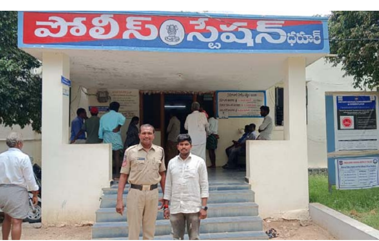
అక్షర విజేత ధర్మార మండలం