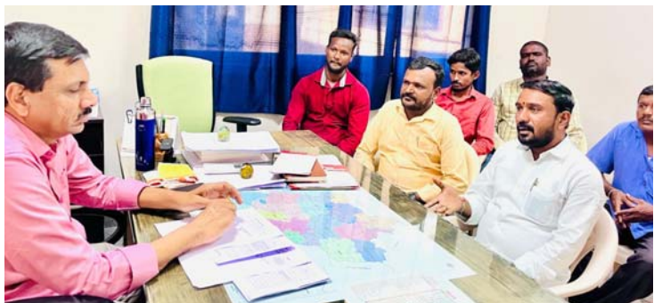
అక్షర విజేత కొండపాక