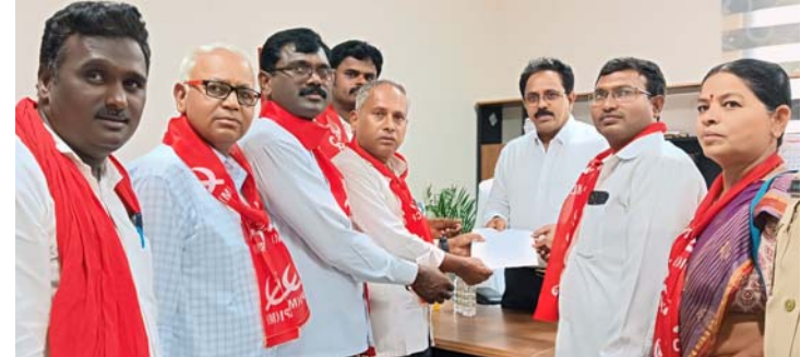
అక్షర విజేత వనపర్తి ప్రతినిధి.