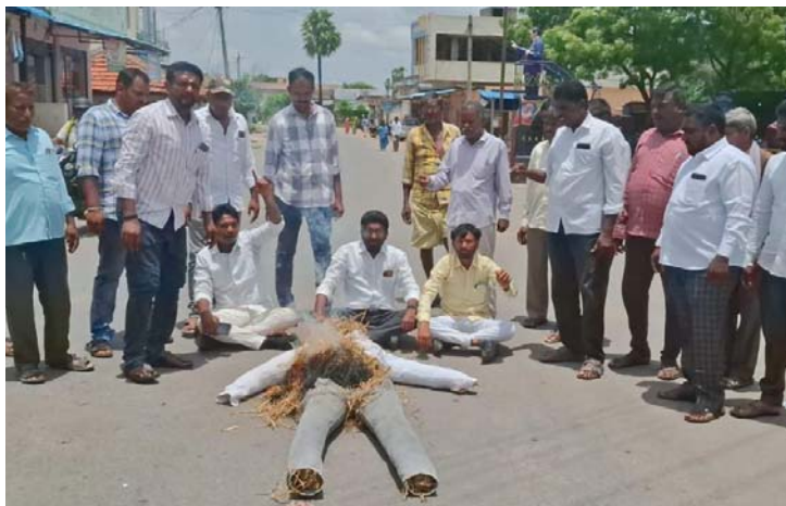
అక్షర విజేత: చిగురుమామిడి