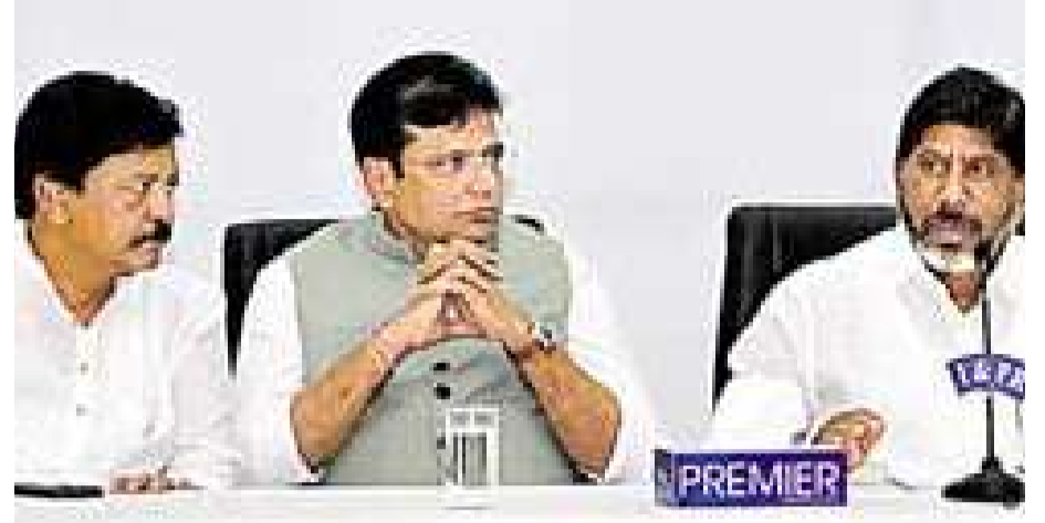
అక్షర విజేత తెలంగాణ స్టేట్ మొదటిపేజీ తరువాయి