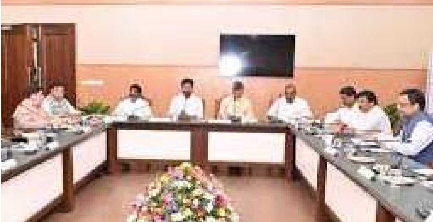
అక్షర విజేత తెలంగాణ స్టేట్ మొదటిపేజీ తరువాయి

ప్రజాభవన్లో శనివారం చరిత్రాత్మక ఘట్టం ఆవిష్కృతమైంది. ఉమ్మడి రాష్ట్ర విభజన తర్వాత పదేళ్లుగా అపరిష్కృతంగా ఉన్న సమస్యలపై తెలంగాణ, ఆంధ్రప్రదేశ్ రాష్ట్రాల ముఖ్యమంత్రులు ఎనుముల రేవంత్ రెడ్డి, నారా చంద్రబాబునాయుడు ప్రత్యేకంగా భేటీ అయ్యారు. రెండు రాష్ట్రాల ప్రయోజనాలకు అనుగుణంగా అన్ని అంశాలను నిర్ణీత వ్యవధిలో సామరస్యంగా పరిష్కరించుకోవాలని ఇద్దరు సీఎంలు అభిప్రాయపడ్డారు. పెండింగ్ సమస్యలను మూడంచెల విధానంలో పరిష్కరించుకోవాలని నిర్ణయించారు. ఈమేరకు రెండు రాష్ట్రాల ప్రభుత్వ ప్రధాన కార్యదర్శులు, ముగ్గురేసి అధికారులతో ఒక కమిటీ, రెండు రాష్ట్రాల మంత్రులతో మరో కమిటీ ఏర్పాటు చేయాలని, అక్కడ కూడా పరిష్కారమవని వాటిపై ఇద్దరు సీఎంల సమక్షంలో చర్చలు జరపాలని నిర్ణయం తీసుకున్నారు. ఈ భేటీలో ఇరు రాష్ట్ర ప్రభుత్వాల విజ్ఞప్తులను అధికారికంగా ఇచ్చివుచ్చుకున్నారు.