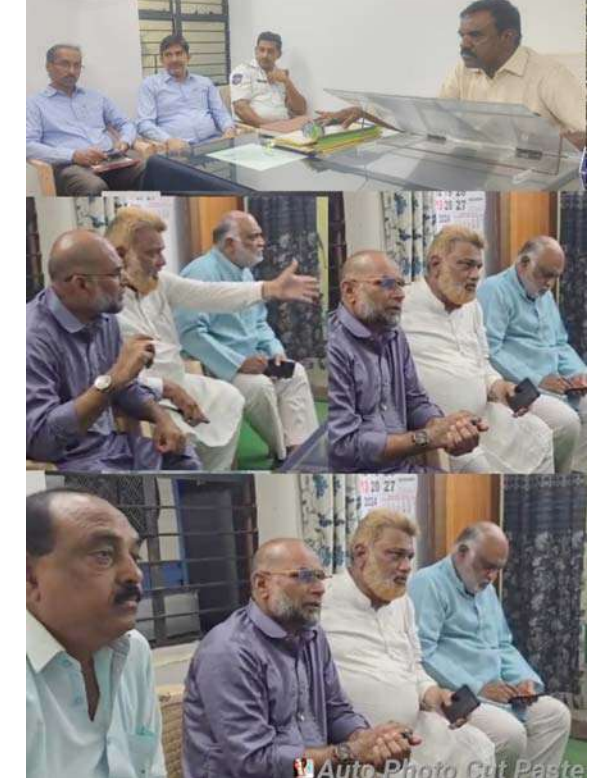
సంబంధిత అధికారులకు ఆదేశాలు జారీ చేసి ఈ విషయమై సంబంధిత అధికారులకు ఆదేశాలు జారీ చేసి త్వరితగతిన అమలు చేస్తామని హామీ ఇచ్చారు.

అధికారులు చెబుతున్నారు. గోశాల రోడ్డు విస్తరణ పనులు చేపట్టాలని, గోశాల కమిటీతో చర్చించాలని జిల్లా కలెక్టర్ రాజీవ్ గాంధీ హస్తంతో, పోలీసు కమిషనర్ కల్వేశ్వర్, పోలీసు అధికారులకు ప్రతినిధి బృందం సూచించారు. భారీ వాహనాలను బైపాస్ నుంచి నేరుగా ఖానాపూర్, బోధన్ వైపు మళ్లించాలని అవసరాన్ని ఆయన నొక్కి చెప్పారు. దీంతో పాటు అర్బపల్లి సమీపంలోని రైల్వేగేటు వద్ద ట్రాఫిక్ ఇబ్బందులు కూడా అదుపులో ఉంటాయి. అర్బపల్లి రైల్వేగేట్ ట్రాఫిక్ కారణంగా చాలాసార్లు మూసివేయబడింది. ఇక్కడ నుండి బస్సులు నడపడం కష్టం, ప్రత్యామ్నాయ రహదారిగా గతంలో ఉన్న ప్రభుత్వ ఫ్యాబ్రికేట్ బ్రాహ్ దేవి రోడ్డు, నెహ్రూ పార్క్ బోధన్ బస్టాండ్ ను పునరుద్ధరించే ఆలోచనలో ఉన్నట్లు ట్రాఫిక్ పోలీసు అధికారులు తెలిపారు. దీంతో నగరంలో రోడ్డు ఇరుకగా ఉండడంతో ట్రాఫిక్ ఇబ్బందులు తలెత్తుతున్నాయి కాంగ్రెస్ ప్రతినిధి బృందం అభిప్రాయపడింది. ఈ సమస్యను త్వరితగతిన అమలు చేయాలని కాంగ్రెస్ నేతలు డిమాండ్ చేయడంతో పాటు ప్రత్యామ్నాయ నూచనలు చేశారు. తరువాత, షెడ్యూల్డ్ నేషన్లు, మైనారిటీ వ్యవహారాల ప్రభుత్వ నలహోదారు మహమ్మద్ అలీ షబ్దీర్ కు సమావేశం యొక్క పరిణామాలు గురించి తెలియజేశారు. ఈ విషయమై