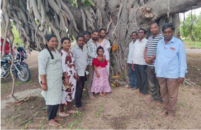
అక్షర విజేత. రామయంపేట

మెదక్ జిల్లా రామయంపేట మండలం కాట్రియాల గ్రామంలో ఆర్యవైశ్య మహాసభ ఆధ్వర్యంలో ఆషాఢ మాసం సందర్భంగా రాజరాజేశ్వరి మాతకు ప్రత్యేక పూజలు నిర్వహించారు. గ్రామానికి చెందిన ఆర్యవైశ్య మహాసభ సభ్యులు వనభోజనాల కార్యక్రమాన్ని నిర్వహించారు. వాసవి మాత కన్యకా పరమేశ్వరికి ప్రత్యేక పూజలు నిర్వహించినానంతరం వనభోజన కార్యక్రమాలను ఘనంగా నిర్వహించారు. లోక కళ్యాణార్థం రాష్ట్ర ప్రజలంతా సుభిక్షంగా ఉండాలని, పాడి పంటలు బాగా పండాలని అమ్మవారిని కోరుకున్నట్లు తెలిపారు.