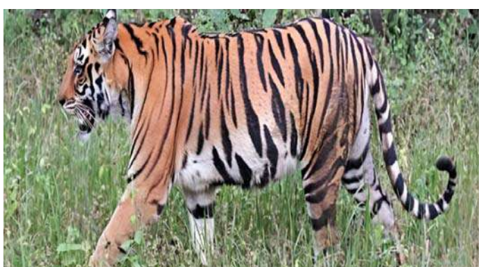
అక్షర విజేత కాగజ్గర్ ప్రతినిధి

కొమురం ఖేం జిల్లా కాగజ్గర్ నగర్ మండలంలోని అటవీ రెంజెలో పెద్దపులి సంచరిస్తున్నట్లు ఎఫ్ఆర్ఓ రమాదేవి ఆదివారం తెలిపారు. పట్టణ సమీప గ్రామాలైన అంకుసాపూర్, నందిగూడ, నార్లపూర్, గొండ్రి, చారిగాం, కోనిని, రేగులగూడ, ఊట్పల్లి, వేంపల్లి గ్రామాల ప్రజలు అప్రమత్తంగా ఉండాలన్నారు. ఒంటరిగా అటవీ ప్రాంతంలోకి వెళ్లకూడదని సూచించారు. పులి కదలికలు, పాదముద్రలు వంటివి కనిపిస్తే వెంటనే అటవీశాఖ అధికారులకు సమాచారం ఇవ్వాలన్నారు.