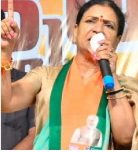
అక్షర విజేత మహబూబ్ నగర్ బ్యూరో