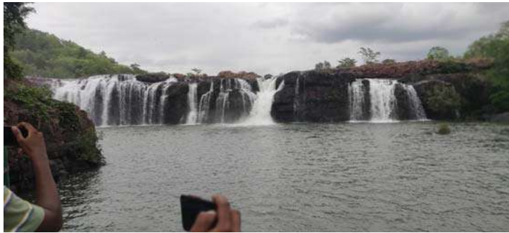
అక్షర విజేత వాణేడు

ములుగు జిల్లా వాణేడు మండలం చీకుపల్లి అడవి ప్రాంతంలో ఉన్న బొగత జలపాతానికి భారీగా తరలివస్తున్న పర్యాటకులు రెండు రోజులుగా ఎగువ ఛత్తీస్ గడ్ అటవీ ప్రాంతంలో కురిసిన వర్షానికి జలకళ సంతరించుకున్న బొగత.50 అడుగుల ఎత్తు నుంచి పాలసురగలా దిగువకు ప్రవహిస్తూ పర్యాటకులను కనువిందు చేస్తున్నా నీటిధార.దట్టమైన అడవి మార్గం గుండా ప్రవహిస్తూ వస్తున్న జల సవ్వడి తో జలపాతం అందాలను చూసి మురిసిపోతున్నా పర్యటకులు.