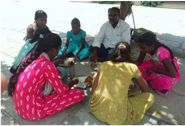
అక్షర విజేత/మరికల్/ ధన్యం: