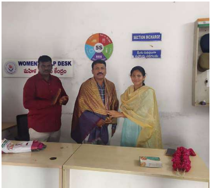
అక్షరవిజేత, కోల్ పల్లి

బదిలీపై వెళ్లిన ఏఎన్ఐ అంబడాన్ కు సన్మానం