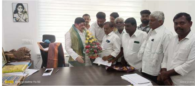
అక్షర విజేత, కొమరవెల్లి: