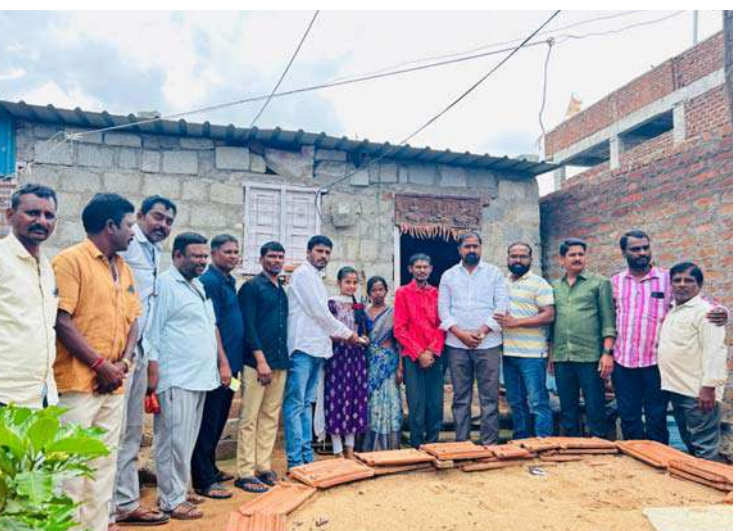
అక్షర విజేత కొండపాక