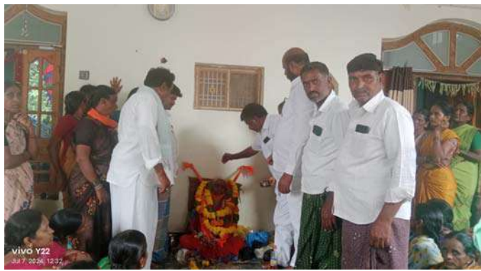
అక్షర విజేత మల్లకల్ మండల