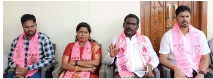
అక్షర విజేత మహబూబ్ నగర్ బ్యూరో