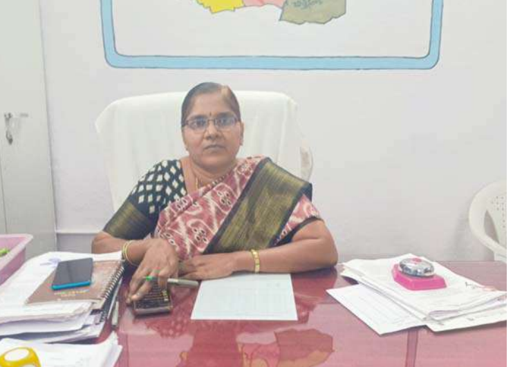
అక్షర విజేత/ మరికల్/ ధన్యవాద: