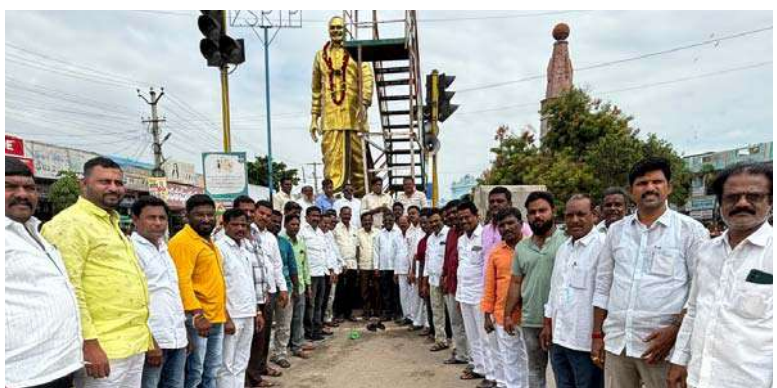
అక్షర విజేత గద్వాల బ్యూరో

గద్వాల జిల్లా కేంద్రంలోని పాత బస్టాండ్ నందు దివంగత ముఖ్యమంత్రి డాక్టర్ వైయస్ రాజశేఖర్ రెడ్డి జయంతి సందర్భంగా ఆయన విగ్రహానికి కాంగ్రెస్ పార్టీ ప్రజాప్రతినిధులు ,నాయకులు పూలమాలవేసి నివాళులర్పించడం జరిగినది. ఈ కార్యక్రమంలో కాంగ్రెస్ పార్టీ నాయకులు కార్యకర్తలు, యూత్ సభ్యులు తదితరులు పాల్గొన్నారు.