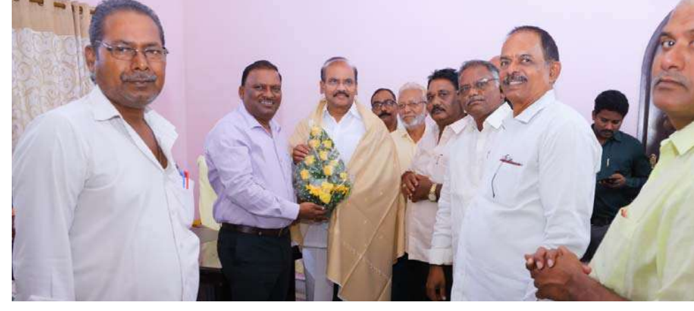
అక్షర విజేత చిలకలూరిపేట

ప్రత్తిపాటిని కలిసిన రాజకీయేతర ఐకాన ప్రతినిధులు, ఆర్టీసీ అధికారులు