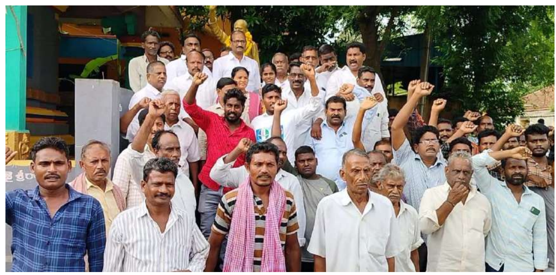
లాంటి అత్యున్నత పథకాలతో దేశంలో ఆంధ్రప్రదేశ్