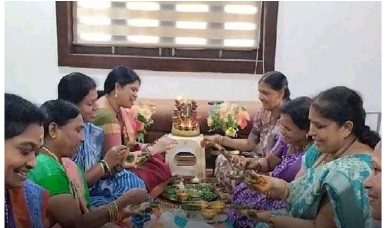
అక్షరవిజేత, దేవరకొండ టౌన్