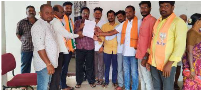
అక్షర విజేత, కొమరవెల్లి: