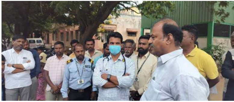
అక్షర విజేత గద్వాల బ్యూరో