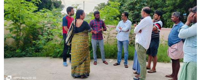
అక్షర విజేత గద్వాల బ్యూరో