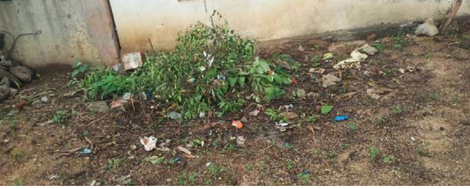
అక్షర విజేత బాన్సువాడ ఆర్ సి ఇన్ఫార్మి