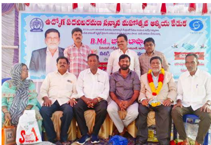
అక్షర విజేత గద్వాల బ్యూరో

పదవీ విరమణ చేస్తున్న మిత్రుడికి సన్మానం చేసి మిగతా జీవితం ప్రశాంతంగా దేవుని జ్ఞాపకాలలో గడపాలని తమ పిల్లల పాపలతో సంతోషంగా నిండు నూరేళ్లు జీవించాలని కోరుకుంటూ తమ శుభాకాంక్షలు తెలియజేశారు ఈ కార్యక్రమంలో తదితరులు పాల్గొన్నారు..