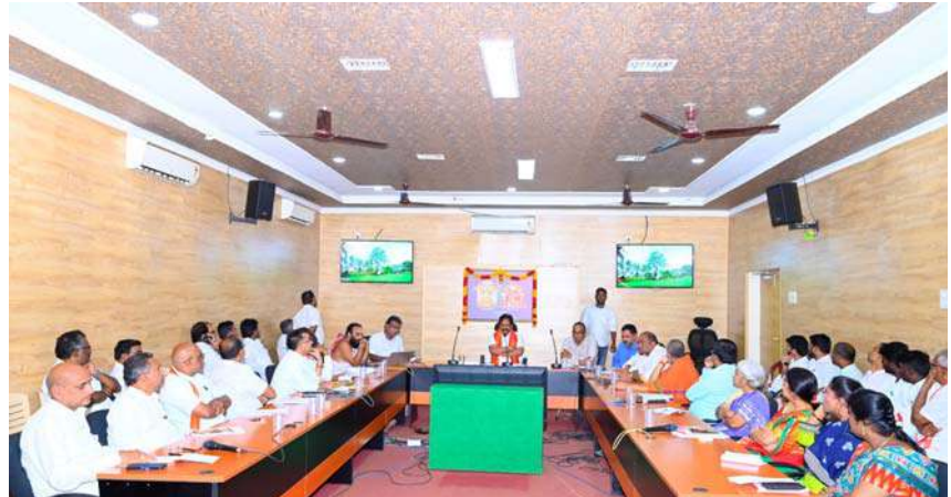
అధికారులు, పర్యవేక్షకులు, ఇంజనీరింగ్ అధికారులు, సంబంధిత సిబ్బంది పాల్గొన్నారు.