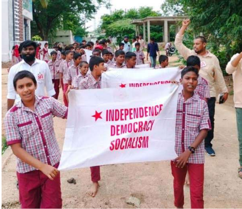
అక్షర విజేత కామరెడ్డి బ్యూరో