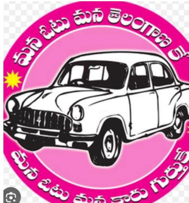
నాయకులు వీరే. దీనిని దృష్టిలో పెట్టుకొని ఇద్దరిలో ఒకరికి బాన్సువాడ పగ్గాలు అప్పగించడానికి గులాబీ నేత ప్రయత్నిస్తున్నట్లు సమాచారం.