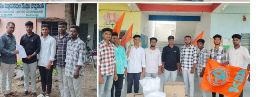
శ్రీహరి/మణికంఠ, ఆదర్శ్, అభినయ్,తదితరులు పాల్గొన్నారు.