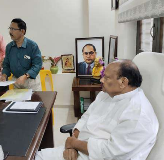
కూడ ప్రతిపాదనలు అధికారులు యనమల ముందు ఉంచారు.

భూమి ఉంది, మార్కెట్ విలువ తదితర అంశాలపై సమగ్ర నివేదిక ఇవ్వాలని ఆయన ఆదేశించారు. ఏ రైతుల సువి భూమిని కొనుగోలు చేశారూ, అల్లిదారుల వివరాలు ఇవ్వాలన్నారు అదే విధంగా అక్కడక్కడా లేఅవుట్లో సామాజిక అవసరాలకు సంబంధించిన స్థలాలు ఆక్రమణకు గురైనట్లు, కొన్ని చోట్ల స్థలాలు అన్యాయాంతం అయినట్లు యనమల దృష్టికి రావడంతో వీటిపై కూడనివేదిక అందజేయాలని యనమల ఆదేశించారు. అదే విధంగా కూడామరియు మున్సిపల్ అధికారులతో జరిగిన సమీక్షలో పట్టణాభివృద్ధి చర్యకు వచ్చింది. అన్నా కేంద్రిస్త ఏర్పాటు