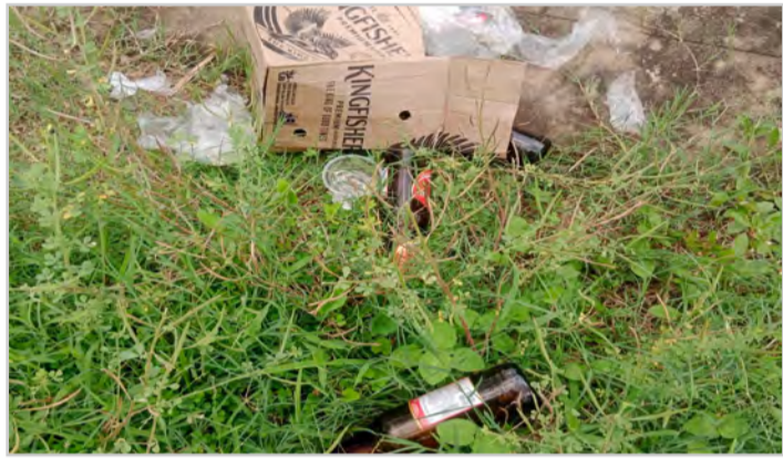
కోట్ల ఆస్తులకు కరువైన రక్షణ ఫర్నిచర్ పరికరాలకు తుప్పు