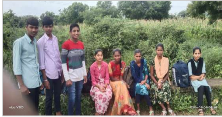
శాఖ అధికారులు స్పందించి దత్తాయపల్లి నుండి పాపిరెడ్డి గూడం వరకు ప్రత్యేక బస్సు ఏర్పాటు చేయాలని కోరుతున్నారు...

రోజు విద్యార్థినిలు కాలినడకన వెళ్లాల్సిన పరిస్థితి ఏర్పడిందని,తల్లిదండ్రులు ఆవేదన వ్యక్తం చేస్తున్నారు.సంబంధిత