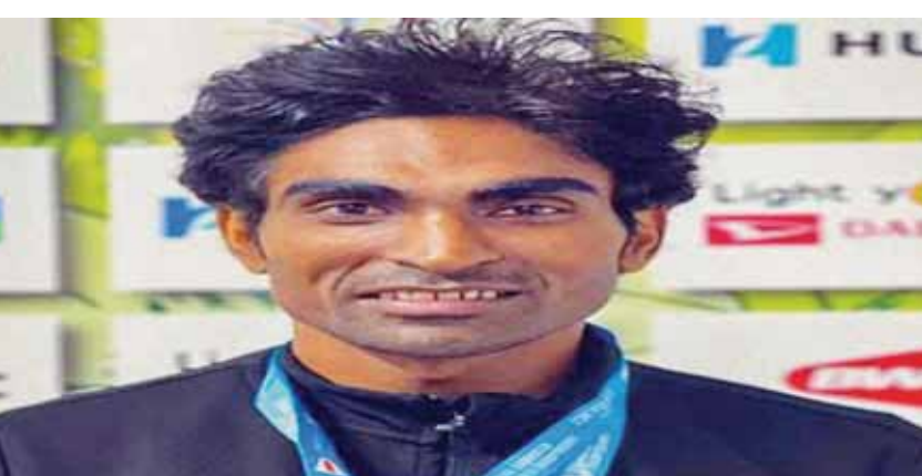
చేస్తున్నట్లు బీడబ్ల్యూఎఫ్ ప్రకటించింది. అలాగే పారిస్ ఆడదు. పారాలింపిక్స్ లో అతను ఆడటం లేదని బ్యాండ్మింటన్ వరల్డ్