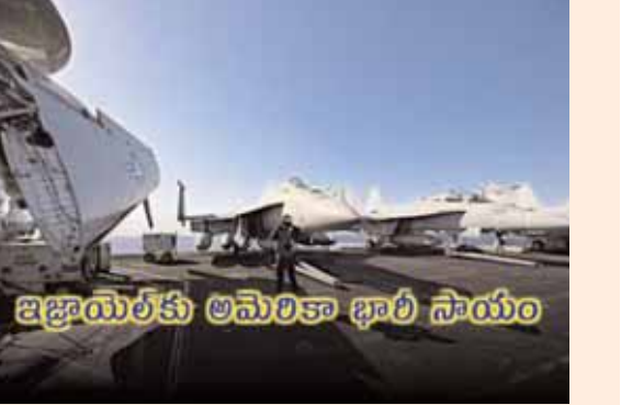
ఇజ్రాయెల్ కు అమెరికా భారీ సాయం

పశ్చిమసియాలో యుద్ధమేఘాలు కమ్ముకున్న వేళ తాజాగా అమెరికా కీలక నిర్ణయం తీసుకుంది. ఇజ్రాయెల్ కు 20 బిలియన్ డాలర్ల విలువైన ఆయుధ విక్రయాల ఒప్పందానికి అమెరికా ఆమోదం తెలిపింది. అందులో అనేక ఫైలర్ జెట్లు, 50పైగా ఎఫ్-15 ఫైలర్ జెట్స్, అధునాతన ఎయర్-టు-ఎయర్ క్షిపణాలు, 120 ఎంఎం ట్యాంక్ ముందుగుండు సాముగ్రీ, అధిక పేలుడు మోర్టార్లు ఉన్నాయి. ఈ మేరకు అమెరికా విదేశాంగ శాఖ ప్రకటన విడుదల చేసింది. అయితే, ఈ ఆయుధాలన్నీ ఎప్పుడు ఇజ్రాయెల్ కు చేరుకుంటాయనేది తెలియలేదు. వీటన్నింటినీ ఇజ్రాయెల్ కు అప్పగించడానికి కొన్నేళ్లు పట్టుకున్నట్లు సమాచారం. అమెరికా ఇవ్వనున్న ఈ ఆయుధాలు ఇజ్రాయెల్ సైనిక సామర్థ్యాన్ని దీర్ఘకాలికంగా పెంచుకోవడానికి సాయపడనుంది. కాగా, ఇజ్రాయెల్ పై ప్రతీకార కాంక్షతో రగిలిపోతున్న ఇరాన్, దాడికి సిద్ధమైనట్లు వార్తలు వచ్చాయి. ఈ నేపథ్యంలో ఇజ్రాయెల్ ఆయుధ విక్రయ ఒప్పందానికి యూఎస్ ఆమోదించడం గమనార్హం.