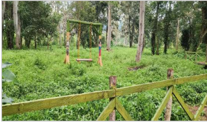
అరకులోయ అటవీశాఖకు శాపం.