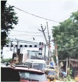
పరిష్కరించాలని వాహనదారులు, ప్రయాణికులు, ప్రజలు కోరుతున్నారు...

అక్రమ విజేత, రంగారెడ్డి డివిజన్: షాద్ నగర్ వట్టలలోని చటాన్ పల్లి రైల్వే స్టేషన్ వైపు వెళ్లే గేట్ వద్ద విద్యుత్ స్తంభాలు ఒకవైపు ఒరిగి ప్రమాదభరితంగా మారాయి. దీంతో విద్యుత్తు అపాయనం కలిగి ప్రమాదం ఉందని వాహనదారులు ప్రయాణికులు బెంబేలెత్తిపోతున్నారు. అసలే వర్షాకాలం, అపై ప్రధాన రైల్వే కూడలి, సైగా వర్షాకాలం సమయంలో ఈదురు గాలులకు ఎక్కువ పడిపోతుందనే భయపడుతున్నారు. నిత్యం పొద్దున్నే లేస్తే ఆర్భాటం వరకు భార వాహనాలతో పాటు స్కూల్ బస్సులు, ప్రభుత్వ ప్రైవేటు, వాహనాలు, ప్రయాణికులు, ప్రజలు ఈ రైల్వే గేటు నుండి వెళ్లడంకోసం ఎప్పుడు విసుపుతుందో అని తెలియని ఆందోళన గురవుతున్నారు. ఇక్కడనూ సంబంధిత శాఖ అధికారులు స్పందించి వెంటనే సమస్యను