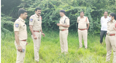
సంఘటన స్థానాన్ని పరిశీలించిన డి ఏస్ పి, పోలీస్ సిబ్బంది