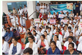
-సిబిఐ నివృత్రాతంగా విచారణ జరపాలి