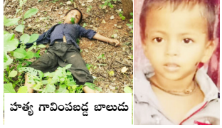
హత్య గావించబడ్డ బాలుడు