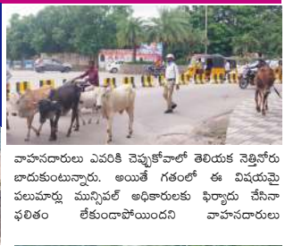
వాహనదారులు ఎవరికి చెప్పకేవలం తెలియక వెళ్తున్న వారుకుంటున్నారు. అయితే గతంలో ఈ విషయమై పలుమార్లు మున్సిపల్ అధికారులకు ఫిర్యాదు చేసినా ఫలితం లేకుండాపోయింది వాహనదారులు

అక్షర విజేత, నిజామాబాద్ ప్రతినిధి : నిజామాబాద్ నగరంలో రోడ్లపై వెళ్తున్న వాహనాలకు పశువులు (ఎద్దులు) తిప్పే చేస్తున్నారు. నగర ప్రజలు ఇప్పటికే తీవ్ర ప్రాధిక సమస్యతో ఇబ్బందులు ఎదురవుతుంటే రోడ్ల