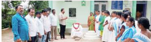
అక్షర విజేత : అభ్యుద్ధ : తెలంగాణ నిర్ధాంతకర్త ఉద్యమ స్ఫూర్తి ప్రధాన అధ్యక్షుల కొత్తపల్లి జయశంకర్ జయంతి వేడుకలు ప్రాథమిక ఆరోగ్య కేంద్రంలో ఘనంగా నిర్వహించడం జరిగినది. ఈ సందర్భంగా