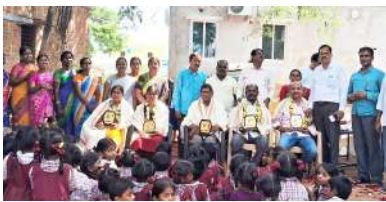
అక్షర విజేత సంఘసూచన:- నంగనూరు మండలం నర్సిపల్లి ప్రాథమిక పాఠశాలలో గత కొన్ని సంవత్సరాలుగా విద్యార్థులకు విద్యాబుద్ధులు నేర్పే గత నెలలో జరిగిన బదిలీలలో ఇతర పాఠశాలలకు వెళ్లిన ఉపాధ్యాయులకు ఆత్మీయ వీడుకోలు సమావేశం నిర్వహించడం జరిగినది. ఈ సమావేశంలో