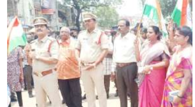
ఆత్మ రక్షణ, గోపాలపురం : తూర్పుగోదావరి జిల్లా, గోపాలపురం నియోజకవర్గం, దేవరపల్లి మండలం దేవరపల్లి గ్రామంలో దేశ ప్రధాని నరేంద్ర మోడీ ఆదేశాల మేరకు, హర్ ఘర్ తిరంగ అనే కార్యక్రమాన్ని