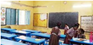
అక్షర విజేత : తోరూరు, మహబూబాబాద్ ప్రతినిధి : పండ్ల ఆగస్టు వచ్చింది అని పిల్లలతో స్వామి శుభ్రవచక్రమంలో చీపిట్ల బాబు కర్రలతో పనులు చేయిస్తున్న సంఘటన మహబూబాబాద్ జిల్లా తోరూరు పట్టణ కేంద్రంలోని అంబేద్కర్ నగర్ కాలనీ ప్రాథమిక పాఠశాలలో జరిగింది. రెండు రోజుల్లో పండ్ల ఆగస్టు ఉండని ఉపాధ్యాయులు స్కూల్ పిల్లలతో స్వామి శుభ్రం చేయిస్తూ ఉడిపిస్తూ బాబు దుబిస్తూ వెడ్డి చాకిరి చేపిస్తున్నారు. విద్యార్థులకు బుద్ధులు చెప్పవలసిన ఉపాధ్యాయులు ఇలా స్కూల్ పిల్లలతో పనులు చేయిస్తూ ఉడిపి చూసే తల్లిదండ్రులకు ఎంతగానో బాధ కలిగినది. అదేమిటని ఉపాధ్యాయులను ప్రశ్నిస్తే మా స్కూల్లో అటెండర్లు లేరు పండ్ల ఆగస్టు కోసమే పిల్లలకి పనులు చెప్పడం ఇదే