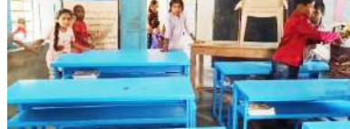
పెద్ద నేరం కాదని దణాయిస్తుందన గమనార్హం. ప్రభుత్వ బడులలో ఇలాంటి చర్యలకు పాల్పడుతున్న ఉపాధ్యాయులపై తగు చర్యలు తీసుకోవాలని అనేకమార్లు పై ఆధికారులకు విన్నపించుకున్నా కూడా ఎలాంటి చర్యలు తీసుకోకుండా ఎందుకు దాటపెట్టాలో తెలియదని తల్లిదండ్రుల అవేదన వ్యక్తం చేస్తున్నారు. ఒక తోరూరు మండల కేంద్రంలోని ఉన్నటువంటి ప్రభుత్వ పాఠశాలలో అనేకసార్లు ఇలాంటి సంఘటనల గురించి అనేక పత్రికల్లో ప్రచురించిన కూడా పదిపదే పిల్లలనే పనులు చేయిస్తూనే ఉన్నారు. ఇలాంటి పనులు చేయించడం వలన భవిష్యత్తులో కార్మికులుగా మారి వాళ్ళ భవిష్యత్తు అందకారంలోకి పోతుందనే భయం తల్లిదండ్రులు పట్టుకుంది. ఇకనైనా స్థానిక ఆధికారులు, జిల్లా ఆధికారులు స్పందించి ఇలాంటి సంఘటనలు పునరావృతం కాకుండా చూడాలని తల్లిదండ్రులు కోరుతున్నారు.