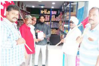
అక్షర విజేత : తోరూరు, మహబూబాబాద్ ప్రతినిధి : కేరళ వాయినాడు వరద బాధితుల సహాయార్థం సిపిఎం తోరూర్ మండల కమిటీ ఆధ్వర్యంలో విరాళాలు సేకరించారు. విరాళాలు విస్తృతంగా సేకరించారు. ఈ