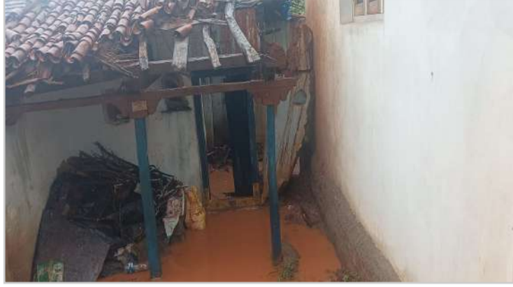
మంగోల్ రెండు ఇండ్లు పాక్షికంగా దెబ్బతిన్నాయి.

ఇబ్బందులకు గురయ్యారు. బందారం గ్రామంలో నాలుగు ఇగిండ్లు అంకిరెడ్డి పల్లెలో ఒకటి మెదినిపూర్ లో రెండు ఇండ్లు