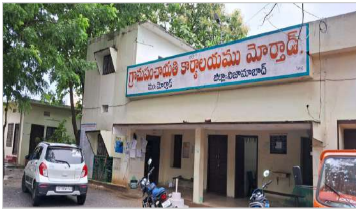
సమాచారం అందిస్తే వారిని సురక్షిత ప్రాంతాలకు తరలించి అన్ని సౌకర్యాలు కల్పిస్తామని మండల కార్యదర్శులు తెలిపారు.