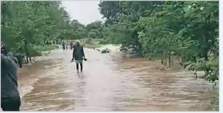
ప్రభుత్వం ఆదుకోవాలంటూ రైతన్నల ఆవేదన.

గురికాకుండా చూడాలని కోరారు. ఎవరైనా శిథిలవస్తలో ఉన్న ఇళ్లలో నివాసం ఉంటున్న వారిని సురక్షిత ప్రాంతాలకు తరలించే విధంగా సహాయ సహకారాలు అందించి ప్రజల మన్ననలు పొందాలని బాల్కొండ నియోజకవర్గం ఇన్చార్జ్ పార్టీ నాయకులు ప్రజా సేవకులు ముత్యాల