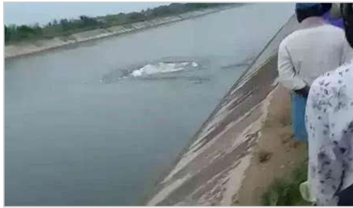
పోతున్నది. దీంతో సమీపంలోని పంటపొలాల్లోకి వరద నీరు పోతున్నది. గండిపడిన ప్రదేశానికి ఇరిగేషన్ అధికారులు చేరుకున్నారు. గండిని పూడ్చడానికి ప్రయత్నిస్తున్నారు.

అక్షర విజేత నల్లగొండ బ్యారో. సూర్యాపేట జిల్లా నడిగూడెం మండలంలో నాగార్జునసాగర్ ఎడమ కాలువకు గండి పడింది. మండలంలోని రామచంద్రాపురం వద్ద కాలువకు గండి పడి కట్ట కొట్టుకుపోయింది. దీంతో పంట మోలాల ద్వారా గ్రామంలోకి వరద నీరు చేరుతున్నది. గతంలో ఫిర్యాదు చేసినప్పటికీ అధికారులు పట్టించుకోలేదని స్థానికులు ఆగ్రహం వ్యక్తం చేస్తున్నారు. కాగా గత నెల 6న కూడా సాగర్ లో లెవల్ కాలువకు గండిపడిన విషయం తెలిసిందే. నల్లగొండ జిల్లా అనుముల మండలం మారేపల్లి వద్ద కాలువకు గండి పడటంతో నీరు పొలాల్లోకి చేరింది. ఇక మూసీ ఎడమ కాలువకు కూడా గండి పడింది. ఆదివారం మధ్యాహ్నం పిల్లలమర్రి, పిన్నాయిపాలం మధ్య ఎడమ కాలువకు గండిపడింది. దీంతో నీరు వృధాగా