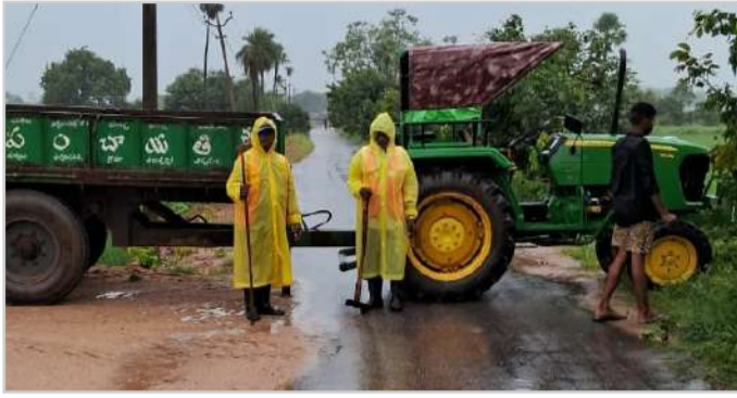
ప్రమాదాల నివారణకు మోర్లాడ్ ఎస్సై భూ పల్లి విక్రమ్ చర్యలు చేపట్టడం వల్ల మండల ప్రజలు హర్షం వ్యక్తం చేస్తున్నారు.

అక్షర విజేత, మోర్లాడ్ : బాల్కొండ నియోజకవర్గం మోర్లాడ్ మండలంలో శనివారం రాత్రి నుండి ఆదివారం ఉదయం వరకు ఎడతెరిపి లేకుండా కురుస్తున్న వర్షాలు నేపథ్యంలో మోర్లాడ్ ఎస్సై భూ పల్లి విక్రమ్ మండలంలోని ఆయా గ్రామాల్లో పర్యటించి పరిస్థితిని పరీక్షించారు. ఈ సందర్భంగా పాలెం ధర్మోరా గ్రామాల మధ్య పెద్ద వాగు పక్కనే ఏర్పాటుచేసిన రోడ్డు గుండా ప్రయాణికులు, వాహనదారులు ప్రయాణం చేయవద్దని తెలియజేశారు. అంతే కాకుండా పాలెం ధర్మోరా గ్రామాల ప్రజలతో చర్చించి, ఇరువైపులా వాహనదారులు ప్రయాణికులు వెళ్లకుండా ప్రమాదాల భారీ న గురి కాకుండా ముందస్తుగా రహదారికి ఇరువైపులా ట్రాక్టర్లను ట్రాలీలను అడ్డంగా ఏర్పాటు