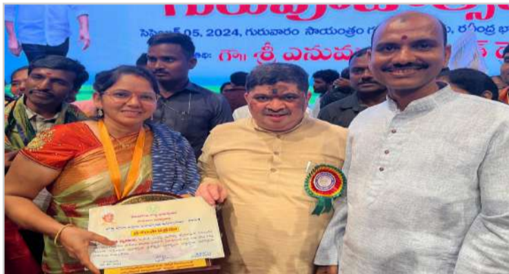
మోడల్ స్కూల్, నవీపేట్ లో పిజిటి కామర్స్ గా పనిచేస్తున్నారు.