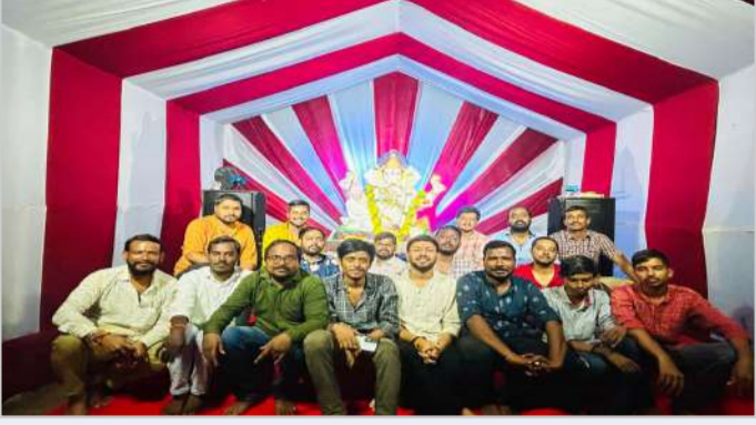
నవయువసేవా సంఘం ఆధ్వర్యంలో గణేష్ కు విశేష పూజలు

అక్షరవిజేత, పాపన్నపేట మండల కేంద్రమైన పాపన్నపేటలో నవయువ సేవా సంఘం ఆధ్వర్యంలో వినాయకుడు కొలువులు దీరారు. గణేష్ నవరాత్రుల సందర్భంగా విగ్నేశ్వరుని ఏర్పాటు చేశారు. ఆదివారం సాయంత్రం వినాయకునికి వేద బ్రాహ్మణ పండితుల మధ్య నిర్వాహకులు, నవ యువసేవ సంఘం సభ్యులు ప్రత్యేక విశేష పూజలు నిర్వహించారు.