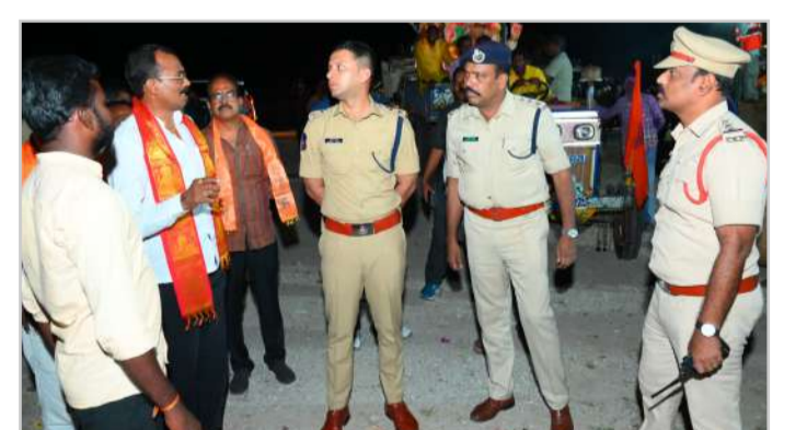
వినాయక శోభ యాత్ర నిర్వహించాలని, పోలీసు వారి సూచనలకు అనుగుణంగా నిర్వాహకులు, ఉత్సవ కమిటీ సభ్యులు నడుచుకొని ప్రశాంత వాతావరణంలో నిమజ్జనం పూర్తి అయ్యేలా సహకరించాలని విజ్ఞప్తి చేశారు.