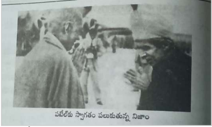
పటేల్ కు స్వాగతం పలుకుతున్న నిజాం

ఈ సంస్థ మొదట్లో ముస్లిం మతస్థులలో చైతన్యం తేవడానికి మరియు వారి సంఖ్యను పెంచడానికి కార్యక్రమాలు నిర్వహించేది. లి1940 లలో సయ్యద్ మహ్మద్ హాసన్ సూచనలతో బహదూర్ యార్ జంగ్ రజాకర్లు అనే స్వచ్ఛంద సేవదళాన్ని స్థాపించాడు